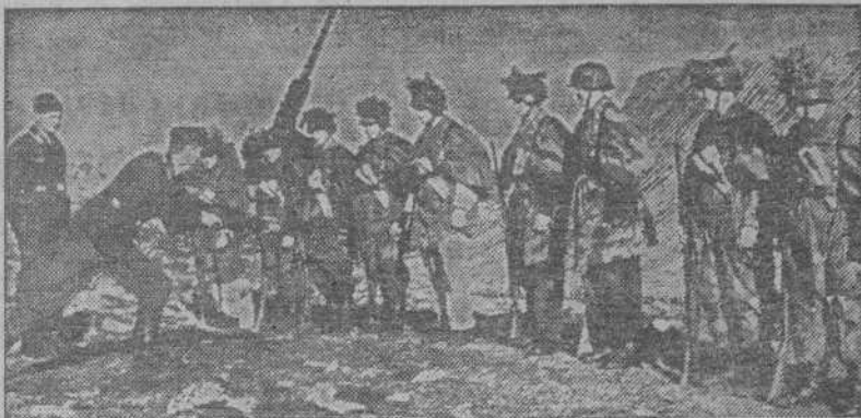
Escuela de soldados de antiaéreos en el Norte de Finlandia.—Los soldados son instruídos por expertos veteranos.