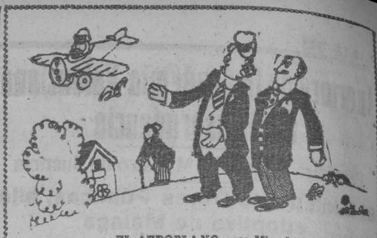
EL AEROPLANO. por Miranda —Que poco ruido mete. —Claro. Como que lleva ruedas de goma.

Un donativo a la hora de comprar los turrones y el pavo, nos hará a todos saborear nuestros manjares y encontrarlos más sabrosos y más dulces, porque el mejor bicarbonato para las digestiones es la conciencia de haberse conducido conforme a los dictados de la hermosa caridad cristiana.