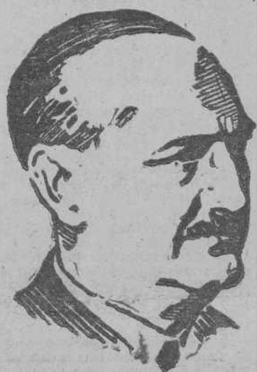
Excmo. Sr. D. Alfonso Peña, Ministro de Obras Públicas

ellos dedicaremos durante el año actual preferencia absoluta. Según los cálculos menos optimistas, podremos inaugurarlos totalmente terminados antes de acabar el año 1945. Este presupuesto extraordinario pasa de los mil millones de pesetas que, como es lógico, los invertiremos en los dos años, 1944 y 1945 EL FERROCARRIL CALATAYUD SANTANDER Sobre el ferrocarril Calatayud-Santander, dice el ministro: "Estas obras también van incluidas en el mismo presupuesto. Si se ha avanzado con menos rapidez de la que esperábamos, se debe a la excavación del túnel de bajada a Santander, que tiene nueve kilómetros de longitud y tiene que ser perforado en la roca viva. Además de éste se están realizando otros tres túneles más en esta misma línea. Otra de las obras más importantes realizadas en relación con Santander la constituye la estación única en la capital montañesa, utilizable por todos los ferrocarriles que afluyen a ella (CONTINUA EN TERCERA PLANA)