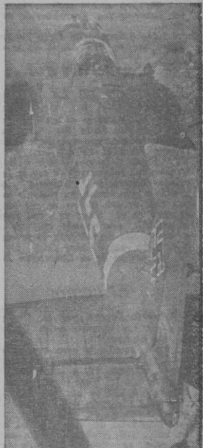
Los aparatos alemanes llegan al lugar que les fué designado como objetivo por el Alto Mando