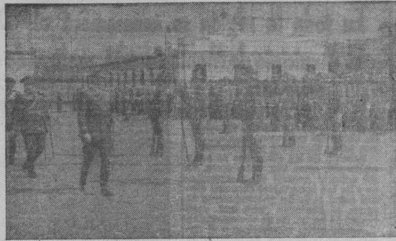
Con asistencia del Ministro del Ejército, general Asensio, se celebró en el Cuartel del Regimiento de Transmisiones de El Pardo, el acto de imponer un distintivo especial creado expresamente para los supervivientes de esta Unidad, que el 27 de julio de 1936 llegaron a Segovia para unirse a las tropas nacionales.