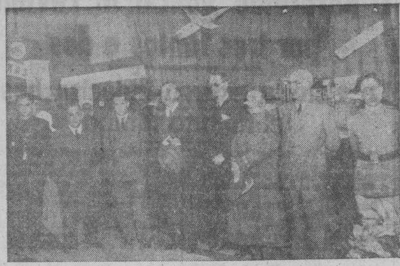
Las autoridades y jerarquías que presidieron la inauguración de la II Exposición de trabajos de Aprendices del Frente de Juventudes

El Frente de Juventudes inauguró solemnemente ayer a las siete de la tarde la II Exposición provincial de trabajos de aprendices. La magnífica exposición está instalada en la planta baja del edificio que en la calle Real ocupa el F. de J. y en los trabajos que figuran en los diversos departamentos se acusa un notable progreso respecto al certamen llevado a cabo el pasado año. Un afán de superación en los aprendices de los ta-