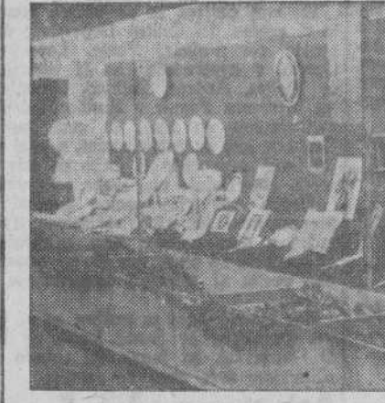
La interesantísima sección de Cerámica.

lles de esta provincia, ha hecho que en esta exposición figuren trabajos muy bien ejecutados que revelan un conocimiento técnico o artístico, según la especialidad a que cada expositor se dedica.