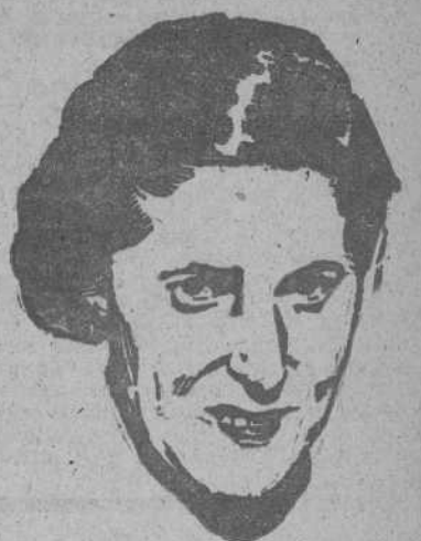
PILAR PRIMO DE RIVERA, DELEGADA NACIONAL DE LA SECCION FEMENINA

EL ESCORIAL, 6.—Están muy adelantados los trabajos de la exposición de (CONTINUA EN TERCERA PLANA)