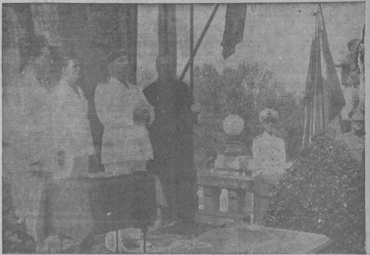
El Caudillo, en vibrante alocución, exhorta a los alumnos a llevar a sus pueblos apasionados anhelos de mejoramiento social, en lo cultural y en lo económico, prometiéndoles el apoyo más decidido para tan trascendental tarea.