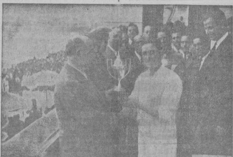
El segundo premio, Copa del Ayuntamiento, ganado por la trainera "Farruca", del Liceo de Monelos