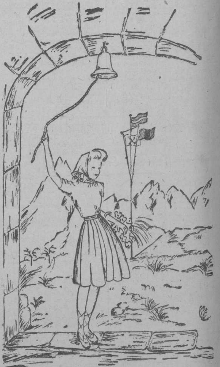
"Nosotros queremos una Patria que sea casa y nave, cimiento y movimiento, seguridad y aventura"—(José Antonio)