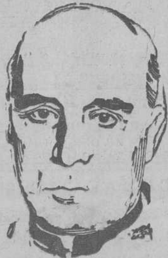
DON MIGUEL ASÍN PALACIOS

SAN SEBASTIAN, 14.—Ha fallecido en esta ciudad, donde veraneaba, don Miguel Asín Palacios, director de la Real Academia Española. El finado era también miembro de las Real Academia de la Historia y de la de Ciencias Morales y Políticas, catedrático jubilado de la Universidad Central, vicepresidente primero del Consejo Superior de Investigaciones Científicas, director de la Escuela de Estudios Árabes de Madrid, procurador en Cortes, etcétera, etc.—(CIFRA).