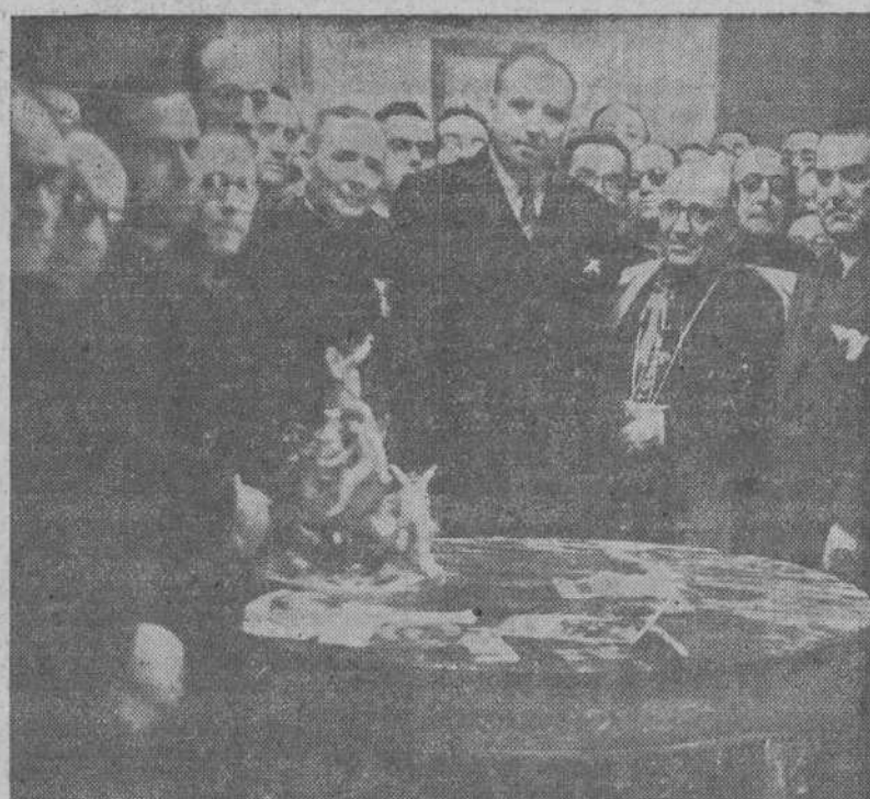
El ministro de Justicia, don Eduardo Aunós, rodeado de los sacerdotes que asistieron a los Cursos para capellanes de Prisiones.