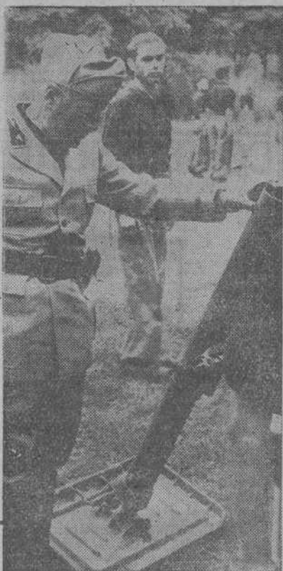
Durante una visita realizada en el frente adriático, el Duce inspecciona las armas de sus soldados