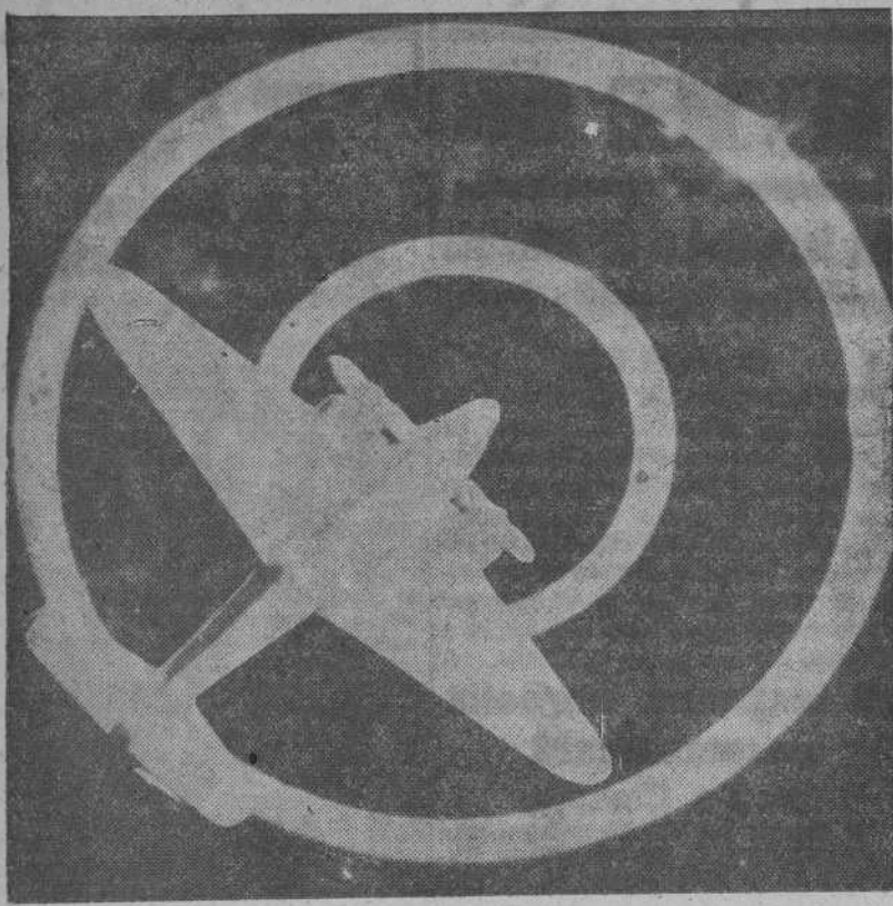
Una nueva lámpara visora, ideada por los ingenieros luminotécnicos americanos, permite a los ametralladores apuntar sus armas cara a la luz del sol. Los dos círculos blancos del visor destacan perfectamente a pesar del resplandor, al apuntar la ametralladora contra un modelo en miniatura colocado sobre el fondo de un sol brillante.