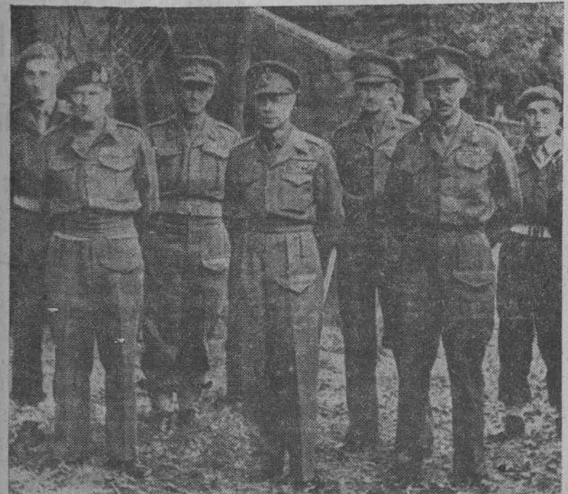
El Rey de Inglaterra con los generales Montgomery y Dempsey, y otros ayudantes, durante la reciente visita que el Monarca inglés hizo al frente holandés.