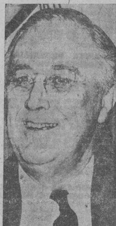
ROOSEVELT elegido por cuarta vez Presidente de los Estados Unidos.