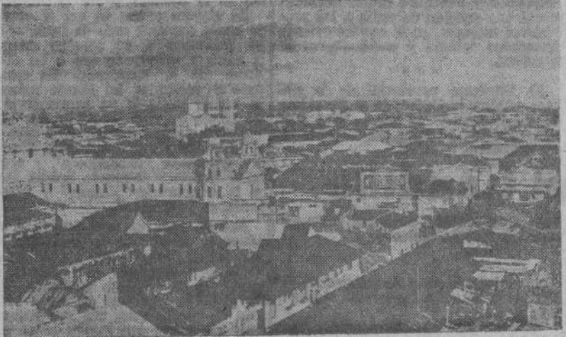
MANILA, capital de las Filipinas, a 150 kilómetros de la cual se encuentran las tropas norteamericanas que han desembarcado en las playas de Lingayen, isla de Luzón.

Siguen desembarcando efectivos en Lingayen