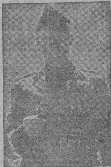
El general Anders