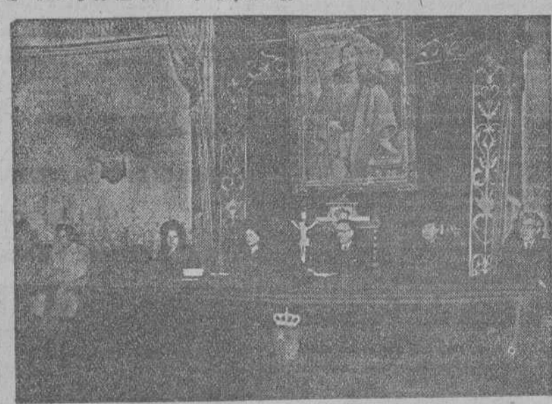
SANTIAGO.—Presidencia de la XI Semana de Misiones Pedagógicas, organizada por el Consejo Superior de Investigaciones Científicas.