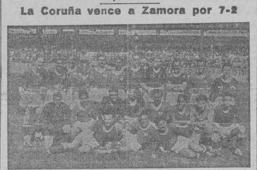
Equipos del Frente de Juventudes de La Coruña y Zamora, que ayer dieron comienzo al campeonato de fútbol de sector del Frente de Juventudes, para el trofeo del Caudillo

Ante numeroso público que ocupaba las gradas del Estadio, se celebró ayer a las doce de la mañana la inauguración oficial del Campeonato de Sector del F. J., con el partido La Coruña-Zamora.