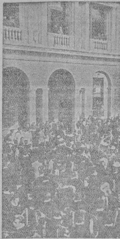
Ante el edificio de la Secretaría General del Movimiento han celebrado en la mañana del martes un concierto las Estudiantinas de Córdoba, Salamanca, Santiago, Valencia, Valladolid y Madrid, que se encuentran en Madrid para tomar parte en el concurso de Estudiantinas

GRAN CUARTEL GENERAL DEL CUERPO EXPEDICIONARIO ALIADO EN EL OESTE, 7.—El comunicado oficial del general Eisenhower dice que las tropas aliadas han conquistado 18 ciudades y pueblos alemanes, entre ellos Colonia, y han entrado a cinco más. El 6 de marzo fueron capturados 486 prisioneros. En la cabeza de puente de Wesel—añade el comunicado—los aliados