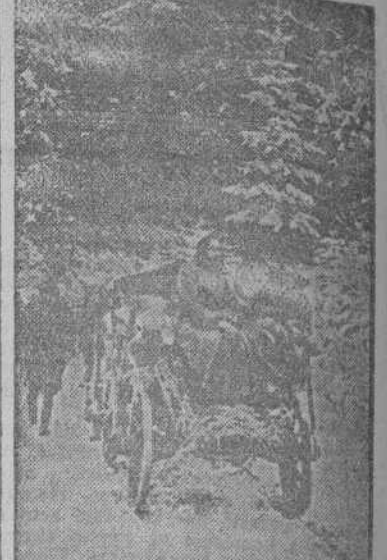
Voluntarios ucranianos que luchan al lado del Ejército alemán, ayudan a sus compatriotas a huir de las hordas bolcheviques y los acompañan hacia la retaguardia germana.

en silencio hasta ayer, indica que las operaciones toman cada vez más un aspecto de batalla decisiva. Churchill ha asegurado a las tropas, que ha revisado que el paso del Rhin se hará muy pronto. No será solamente el cruce material del río por medio de puentes o lanchas de desembarco. Probablemente serán empleadas en gran escala unidades de desembarco aéreo y quizá no sólo en el Rhin sino también en la costa del Báltico o del Mar del Norte. Se trata de la batalla decisiva. El Ejército alemán sigue manteniendo intactos efectivos importantes. Por eso creemos que la retirada de Rundstedt al otro lado del Rhin es el último movimiento de repliegue que el Ejército alemán puede adoptar. A partir de ahora la batalla decisiva va a ser planteada.