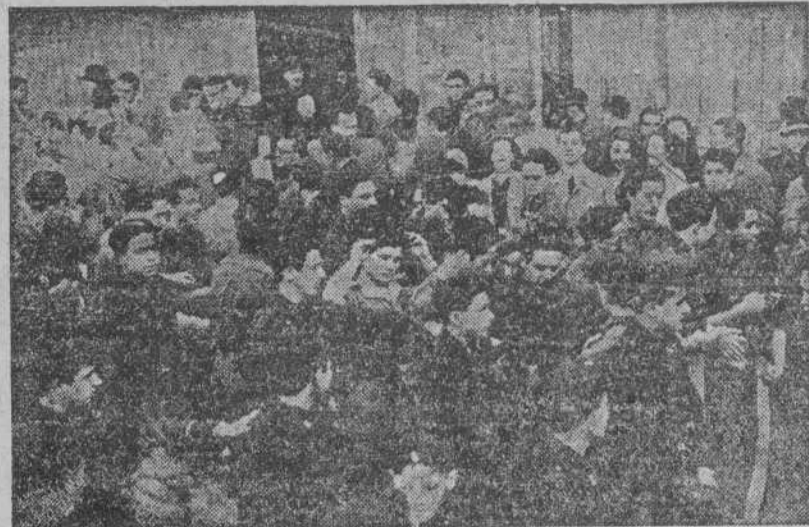
Jerarquías del S.E.U., Frente de Juventudes y estudiantes, al salir de la misa solemne celebrada en la iglesia conventual de Santo Domingo, con motivo de la festividad de Santo Tomás de Aquino

En Santo Domingo hubo una misa solemne, presidida por jerarquías y profesores de Centros docente: