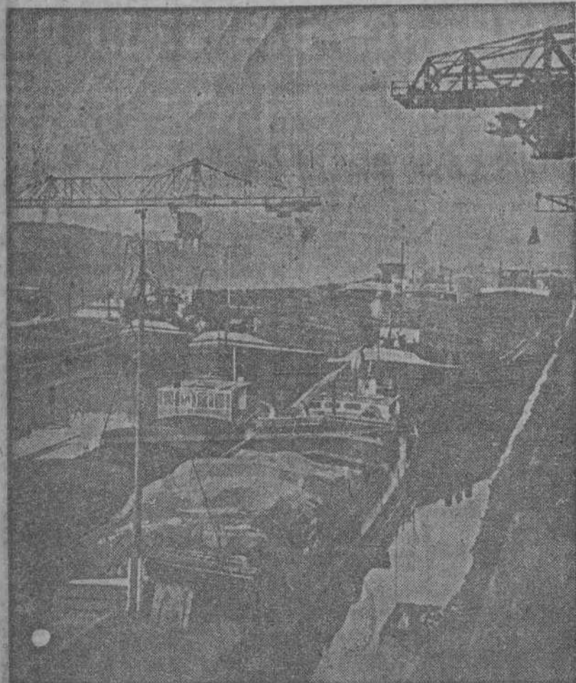
Aspecto del gran puerto fluvial de Duisburgo, uno de los más grandes de Europa y a cuyas inmediaciones llegaron las tropas aliadas

Parece que los rusos han comenzado una gran ofensiva para cruzar el Oder frente a Ber'in