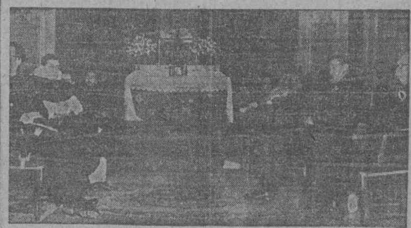
Detalle de la capilla levantada en el paraninfo de la Universidad Central y personalidades asistentes a la ceremonia religiosa organizada por el Sindicato Español Universitario con motivo de la festividad de Santo Tomás de Aquino