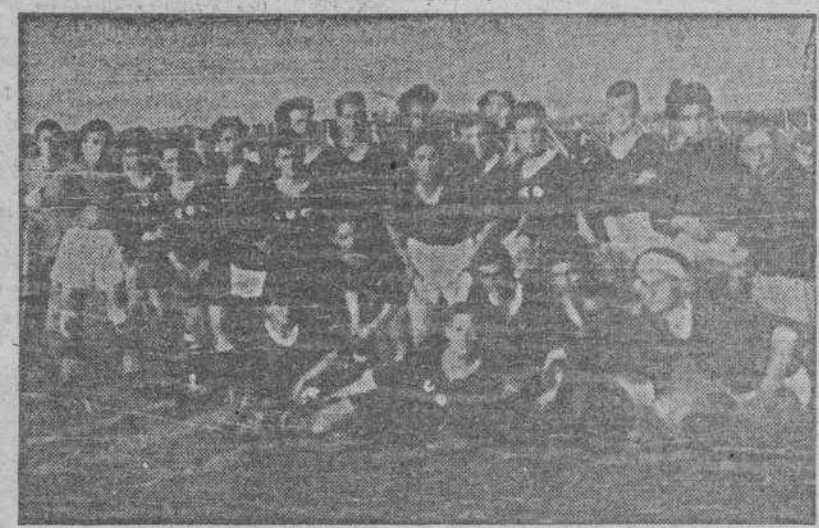
Equipos de Lugo y Pontevedra que ayer jugaron el partido eliminatorio del Campeonato de fútbol de Sector del Frente de Juventudes, para el trofeo del Caudillo. Venció el de Pontevedra por 7 a 2

Uno de los técnicos que asistieron al entrenamiento, manifestó: "El esfuerzo de nuestro equipo ha de ser grande, pero tengamos ya la certeza de su valor, puesto que el valor del adversario nadie lo pone en duda".