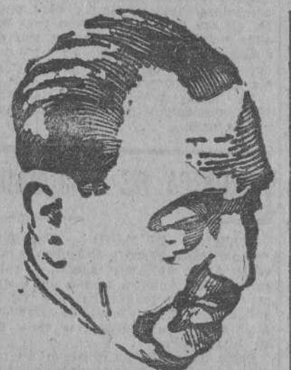
Excmo. Sr. D. José Félix de Lequerica, Ministro de Asuntos Exteriores

"Tan horribles son las atrocidades niponas—dice el Cónsul español en su informe—que no pueden ser adecuadamente descritas en un corto telegrama y así espero la primera oportunidad para hacer un informe personal".—(EFE).