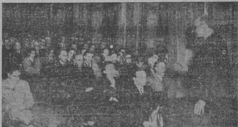
Monseñor Zacarías de Vizcarra dirigiendo la palabra a los hombres y jóvenes de Acción Católica, en el salón de actos del Instituto de Enseñanzas Media

Hoy, de ocho menos cuarto a ocho y media de la noche, en el salón de actos del Instituto, en la Plaza de Pontevedra, Monseñor Zacarías Vizcarra, Consiliario General de la Acción Católica Española, pronunciará una conferencia especial para los médicos, abogados, ingenieros y demás profesiones liberales dedicada a la divulgación de la Acción Católica en que expresará lo que la Iglesia espera de ellos en la inmensa tarea de recristianización de la sociedad y la misión particular que cada profesión debe desempeñar con su enorme influencia en la vida de los pueblos.