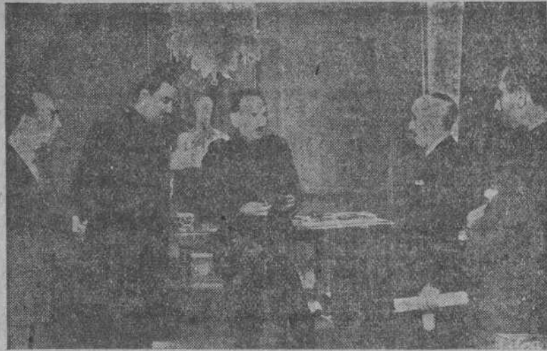
MADRID.—El Ministro y Secretario General del Movimiento, camarada Arrese, ha recibido la Medalla del Milenario de Castilla que le entregaron en su despacho de la Secretaría General el alcalde de Burgos y otras personalidades castellanas.