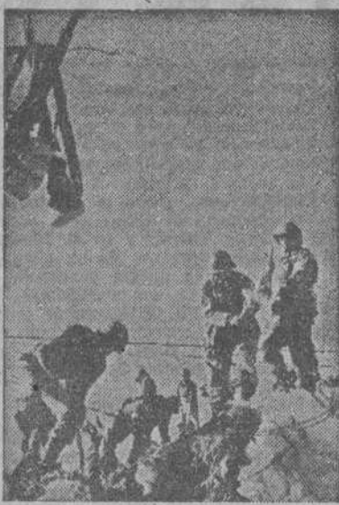
Soldados norteamericanos del Quinto Ejército salvan un paso difícil en un sendero de los Apeninos, utilizado para el abastecimiento de tropas.