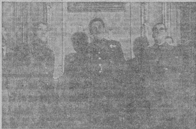
El lunes se ha celebrado la toma de posesión del nuevo Subsecretario de Trabajo, presidida por el Ministro de Trabajo, camarada Girón. Al acto asistieron jerarquías y autoridades.