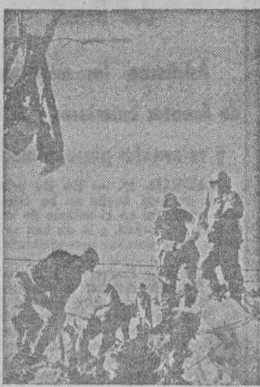
Soldados norteamericanos del Quinto Ejército salvan un paso difícil en un sendero de los Apeninos, utilizado para el abastecimiento de tropas