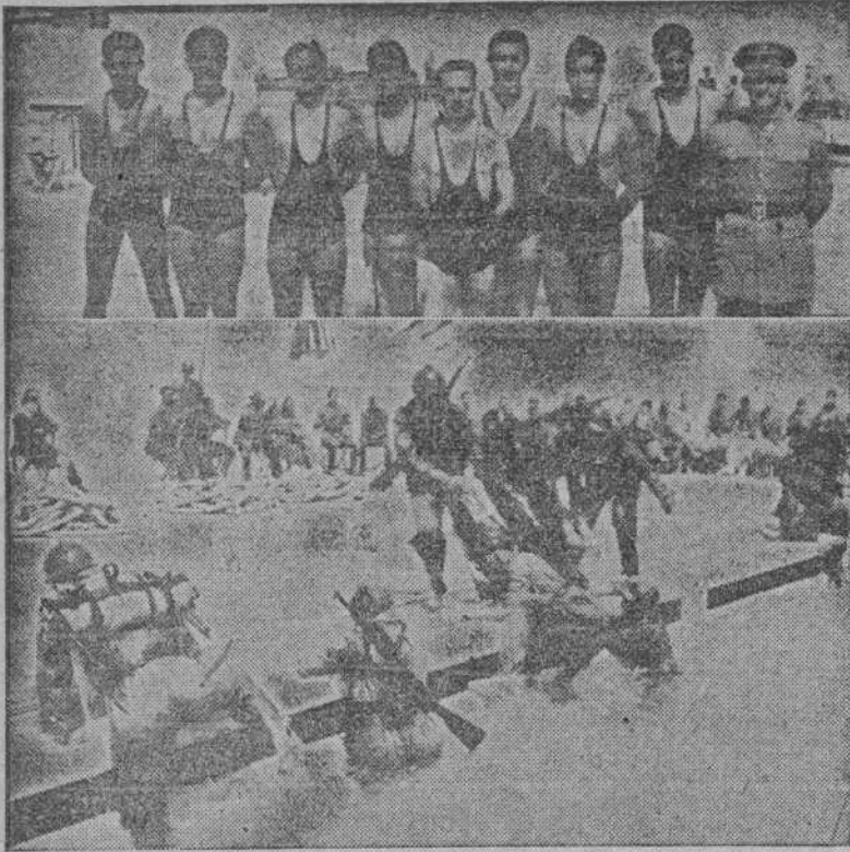
El equipo de natación del Regimiento de Artillería núm. 48, de guarnición en La Coruña, campeón de Galicia en las pruebas celebradas ayer.—Abajo, un momento del ejercicio de "aplicación militar" en el que participaron patrullas de los Regimientos de Galicia.