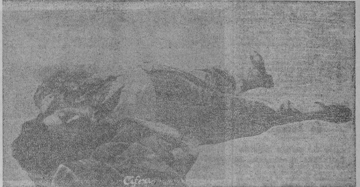
Cadáver de don José Calvo Sotelo, tal y como fué abandonado por sus asesinos en el Cementerio del Este, de Madrid.

Ellas rompieron toda norma democrática de convivencia