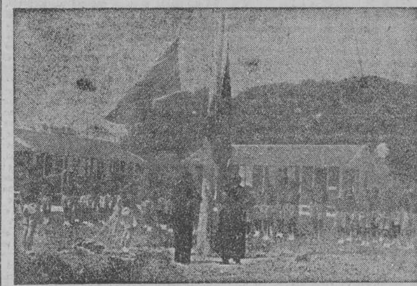
Momento solemne en el campamento "Francisco Franco", de Gandario

Asisten a este turno unos doscientos cincuenta alumnos de los centros de enseñanza de esta capital, que durante veinte días vivirán las jornadas de los campamentos, al igual que se desarrollan en otros.