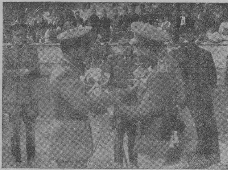
El Gobernador militar efectuando la entrega de trofeos

La selección militar ferrolana ganó (4-1) a la coruñesa en balón-mano