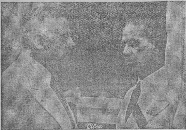
"Acompañé a Mackensen (embajador alemán) a entregar al Duce un mensaje de Hitler, en que éste declara estar convencido de que los dos regimientos unidos por un destino común, deben seguir el mismo camino..."—En la fotografía, Ciano y Von Mackensen, embajador alemán en Roma en aquella época.

La intervención rusa en Polonia conmovió y sorprendió a los italianos, quienes, como de costumbre, no fueron informados de antemano. Después de firmado el pacto germano-soviético, Ciano fué llamado urgentemente a Berlín, donde se le dió una explicación de lo sucedido. Mussolini observaba con envidia como Hitler escalaba la cima de la fama y esperaba con ansiedad que alguien lo detuviese en su ascensión. El Duce rechazó una petición alemana de ayuda naval en el Mediterráneo.