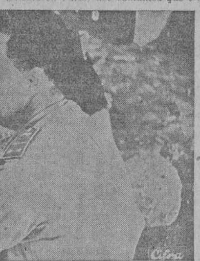
El duque de Aosta ha muerto. Por la tarde, Bismarck ha telefonado diciendo que los alemanes se disponen a lanzar una campaña en la que acusarán al Servicio Secreto inglés de haber asesinado al Duque. Añadió que él, personalmente, consideraba de mal gusto esta campaña. Tiene razón. No hay nada que confirme tal especie". -- En la fotografía, el Duque de Aosta en su puesto de mando durante la guerra en África.