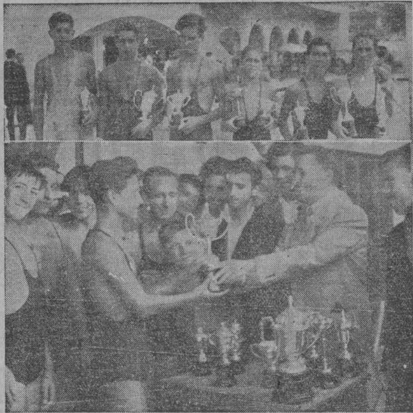
Los premiados en el Campeonato Local de Natación. Abajo, entrega de trofeos

Ayer, a la una y media de la tarde, tuvo lugar en la piscina el reparto de los trofeos correspondientes a los campeonatos locales de natación.