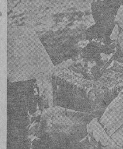
El duque de Aosta ha muerto. Por la tarde, Bismarck ha telefonado diciendo que los alemanes se disponen a lanzar una campaña en la que acusarán al Servicio Secreto inglés de haber asesinado al Duque. Añadió que él, personalmente, consideraba de mal gusto esta campaña. Tiene razón. No hay nada que confirme tal especie". -- En la fotografía, el Duque de Aosta en su puesto de mando durante la guerra en África.