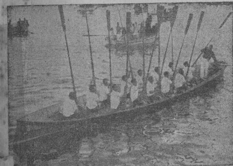
La "María del Carmen", vencedora de la regata de ayer

La "María del Carmen", de San Pedro de Visma, vencedora en la regata de ayer En pugna Monelos-Santa Lucía, ésta se adjudicó el primer asalto