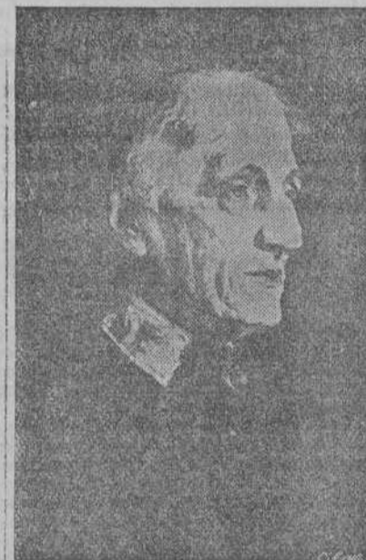
El Cardenal Newman.

BUENOS AIRES, 24.—El ministro de Relaciones Exteriores Ameghino, ha presentado la dimisión al Presidente Farrell, quien le rogó que esperase su contestación por 48 horas, según fuentes dignas de crédito, informa la United Press.—(EFE).