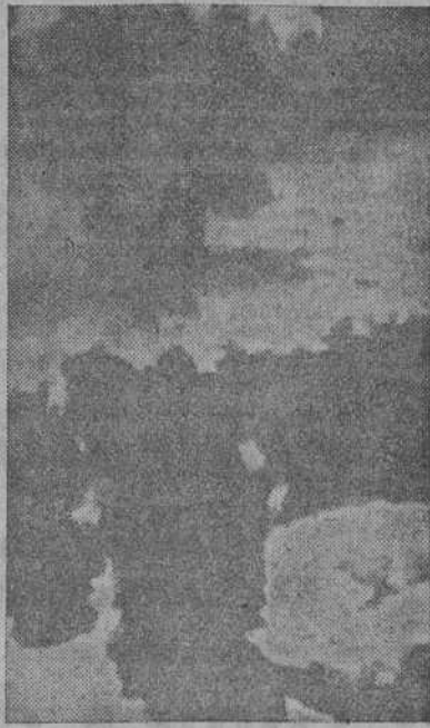
En esta fotografía, tomada desde un avión norteamericano tres minutos después de ser arrojada la segunda bomba atómica sobre Nagasaki, se puede apreciar una enorme columna de humo ascendiendo hasta una altura superior a los 6.000 metros (Foto recibida por radio).