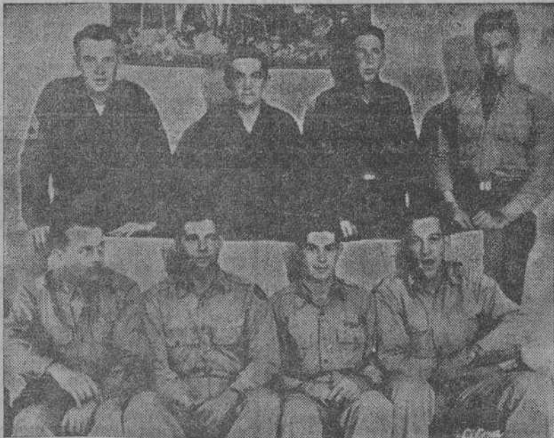
VALENCIA. Oficiales y soldados de la aviación norteamericana, tripulantes de la fortaleza volante que aterrizó, averiada, en Manises, y que reciben estos días multitud de atenciones en la capital valenciana.