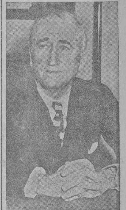
El nuevo Secretario de Estado norteamericano, James F. Byrnes, que ha salido para Londres con objeto de asistir a la reunión de Ministros de Asuntos Exteriores