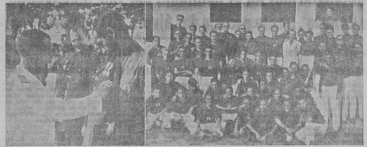
El Secretario General del S. E. U. impuso el emblema de fundador a varios camaradas coruñeses. Camaradas del S. E. U. de toda España que asistieron al curso.

Ayer fué clausurado el segundo turno nacional que celebró el Colegio Mayor "José Antonio". A él han asistido camaradas del S. E. U. de todas las provincias de España, que han pasado 30 días de convivencia falangista.