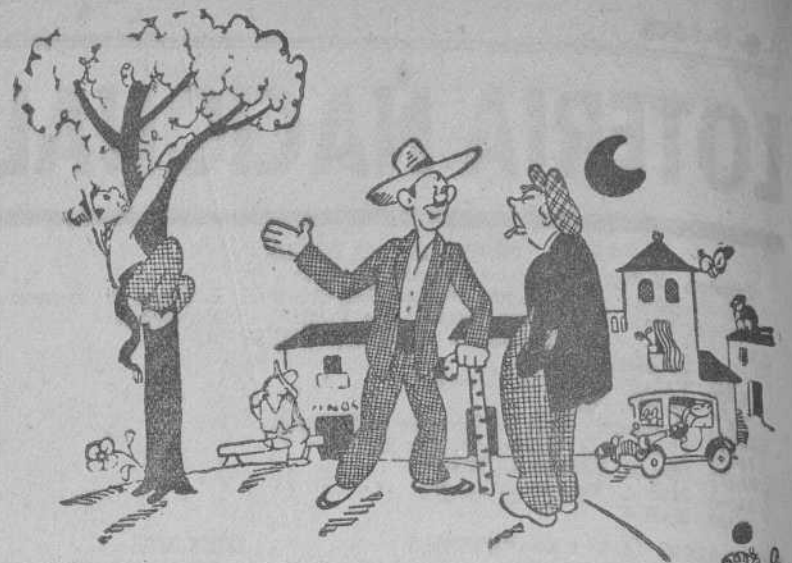
CUCO, por MIRANDA

Una ingente labor, más ingente de todas las que España ha acometido, diseminadas por ciudades, aldeas, campos. Un canto a la paz, el progreso y la hermandad entre todos los españoles. Un himno al trabajo y la laboriosidad, la inteligencia y el tesón sin desmayos. Esto es la reconstrucción de España, por unvenir mejor para todos.