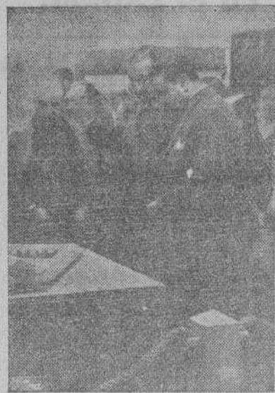
SAN SEBASTIAN. — El ministro de Asuntos Exteriores, Sr. Martín Artajo, con el embajador de Portugal y otras personalidades, en la inauguración de la Exposición de Regiones Devastadas.

Fue el propio Caudillo quien dió el primer impulso a esta tarea de reconstrucción y tuvo la iniciativa de adoptar él mismo pocos pueblos