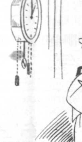
—¡Se ha "parado"...