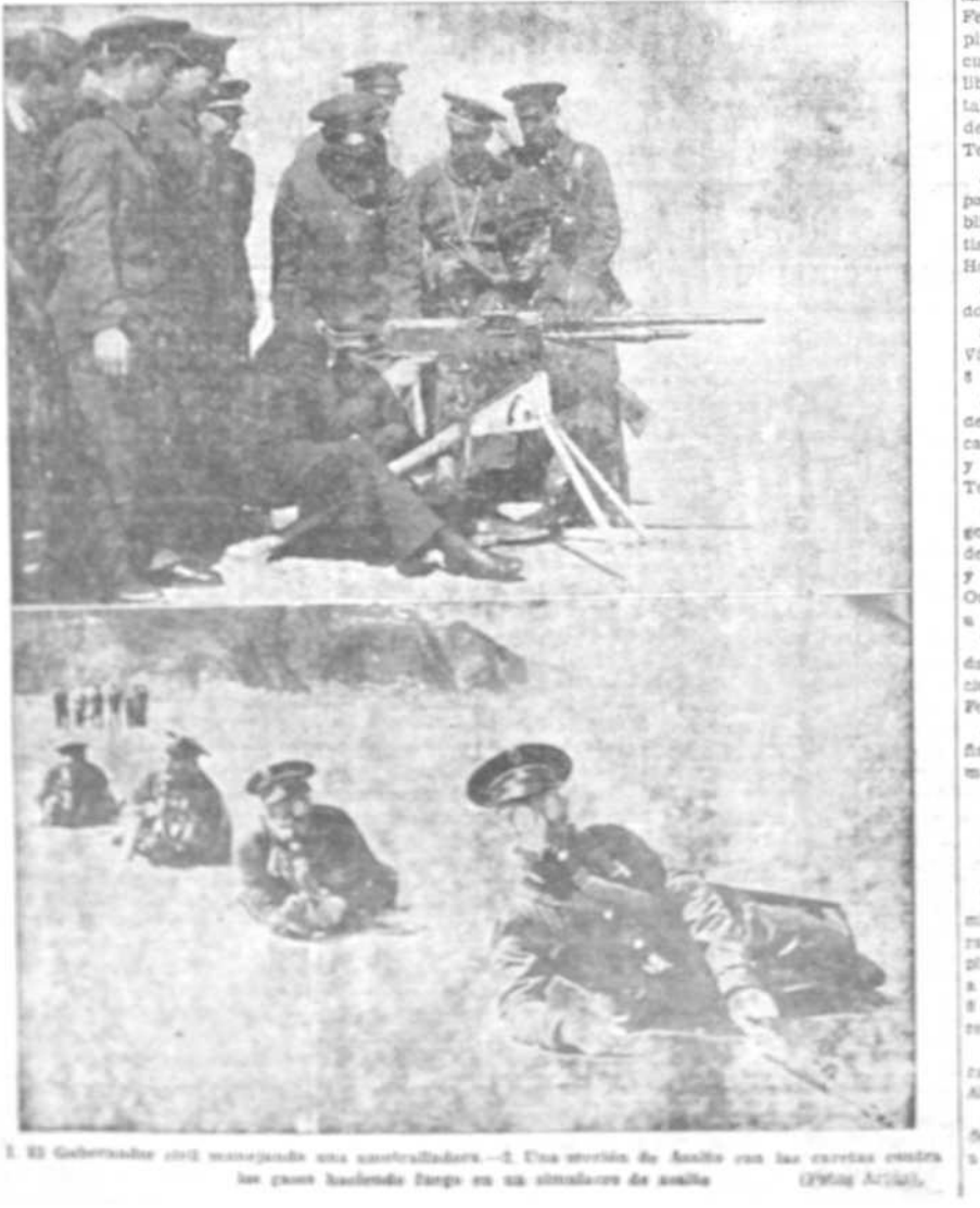
El Gobernador civil presenciando una controladora. Una sección de Asalto con las carteras verdes los guos haciendo fuego en un simulacro de asalto.