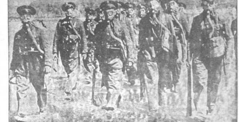
1. Uno de los morteros de los guardias de Asalto que ayer se estrenaron en los ejercicios celebrados en Bastiguero.—2. Un pelotón de guardias de Asalto con las caretas para los gases asfixiantes.

Un sensible accidente cuesta la vida a dos pobres obreros orenses. ESPAÑA.—Resuelta la circunstancia que preocupaba al Presidente del Gobierno, mañana se celebrará Consejo. ¿Nuevo parto de los montes? La actitud de Gil Robles es la misma que expuso en el mitin de la Coruña. Martínez de Velasco y Melguindes Alvarez coinciden con él. En cambio el jefe de la Ceda no está conforme con un comentado artículo que ayer publicó "El Debate". Y Lerroux se niega a hacer manifestaciones, o las hace a medias, que despiertan más vivo interés. Las Cortes se ocuparon del paro obrero y de las bases de la Ley municipal. También decidieron celebrar sesión nocturna.