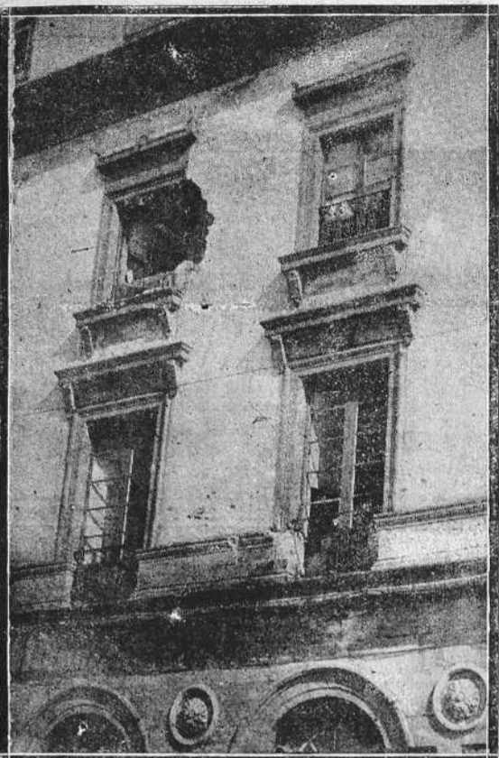
Aspecto parcial del edificio ocupado por el Gobierno civil y la Diputación Provincial, en la fachada correspondiente a la Marina, con los destrozos producidos por la Artillería en vista de que el gobernador civil y los revolucionarios a sus órdenes no obedecieron las intimaciones del Ejército

someter lo que pretenda publicarse a mi Previa Censura.