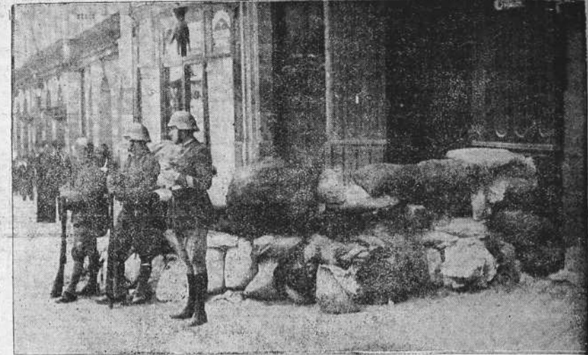
He aquí una de las barricadas levantadas por los revolucionarios en la calle Real, de La Coruña, y que fueron tomadas por las fuerzas militares y demás Institutos armados después de una escasa resistencia

Al Gobierno civil acudieron muchísimas personas de todas las