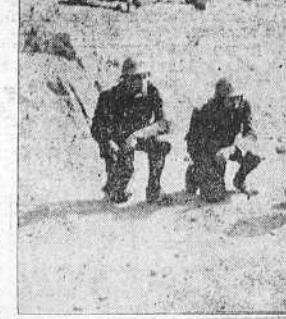
Para dominar a algunos núcleos sediciosos que se habían apostado en las inmediaciones del parque de Joaquín Costa fué preciso emplazar una sección de morteros de Infantería, cuyos disparos ahuyentaron prontamente a los extremistas. He aquí a la sección disponiéndose a lanzar una granada

Ante una España nueva El glorioso Ejército español, con la cooperación valiosísima de todos los demás Institutos armados, sin excepciones colectivas de ninguna clase y con harto escasas excepciones individuales, y asistido por la inmensa masa nacional que no se resigna a que España perezca en el fango de todos los ludibrios, ha asumido una vez más la empresa de salvar a España. A estas horas todo el país vibra de fervores y de entusiasmos, porque el brazo armado de la nación no ha sido sino el instrumento ejecutor de un impulso irrefrenable que latía en todos los espíritus genuinamente españoles. Pueblo y Ejército—y, al decir Ejército, a todos los organismos armados aludimos—son hoy la misma cosa: que nunca existió un paralelismo semejante entre un pensamiento colectivo y su ejecución, ni, tampoco, una fusión más firme entre España y su Ejército, heredero de tantas glorias nacionales y perpetuador de tantas bizarrías.