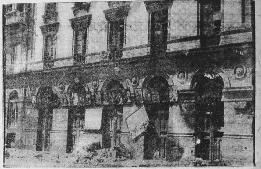
Vista exterior del edificio ocupado por el Gobierno civil y la Diputación Provincial de La Coruña, tal como ha quedado después del bombardeo de que fué objeto en la tarde del martes

DOS BUQUES DE GUERRA Y UN HIDRO En las últimas horas de la tarde se presentaron en bahía un torpedero inglés, un crucero inglés y un "hidro" de la base de Marín. Los tres buques, en medio de las dificultades que les oponían los elementos extremistas, desembarcaron y ocuparon el Consulado Inglés, al objeto de proteger