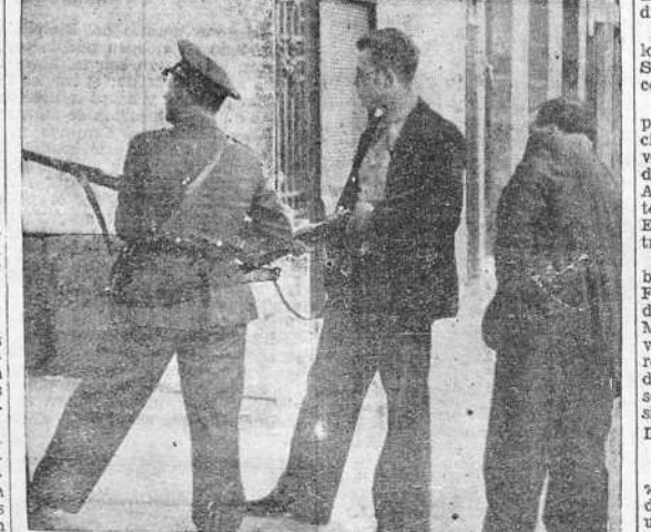
Un guardia civil y un voluntario militarizado vigilan atentamente para descubrir a los "pacos", que, amparados de manera cobarde en la impunidad de alguna habitación, se dedicaban a sembrar la alarma entre la población pacífica