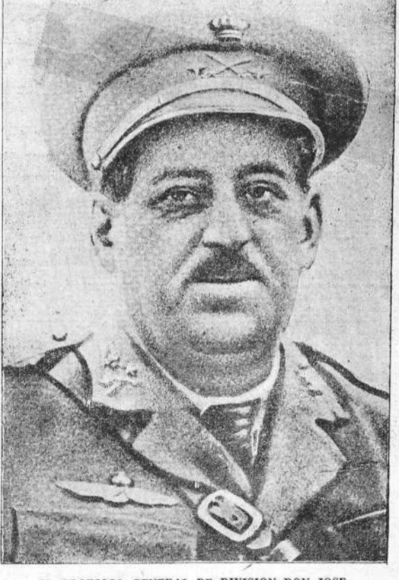
EL GLORIOSO GENERAL DE DIVISION DON JOSE SANJURJO SACANELL

Se incendió la avioneta en que se trasladaba a España desde Estoril