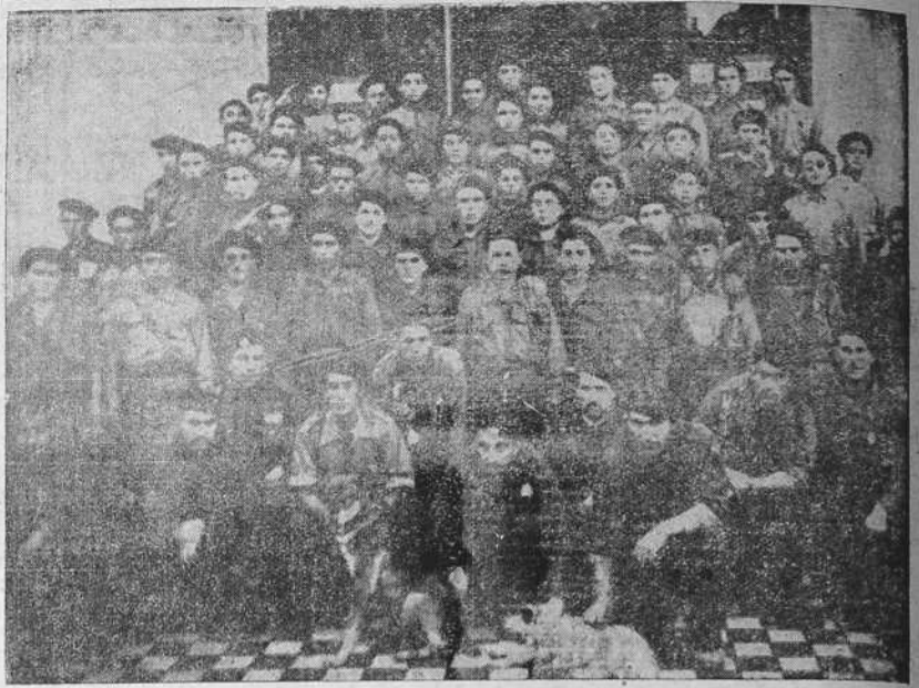
Clases e individuos del requeté de la Coruña que marchan al frente de combate que el Alto Mando les señala.