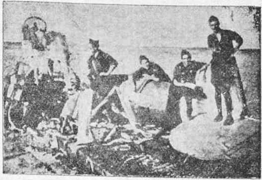
Por todas partes el mismo espectáculo: restos de un avión—indeleblemente marxista—que ha sido derribado por nuestros "cazas" o por nuestra artillería aérea. He aquí lo que queda de uno echado a tierra en las inmediaciones de Madrid.

AIRIS "DA TERRA MEIGA" Antes de nada digamos algo de la vida de estos muchachos. Resulta, en primer lugar, en ellos un acendrado amor a la tierra "meiga" y un puro e indomable patriotismo.