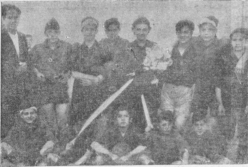
Equipo "Once Flechas", de Mellid, que derrotó al de la Juventud de Acción Católica, en un partido de competición amistosa.