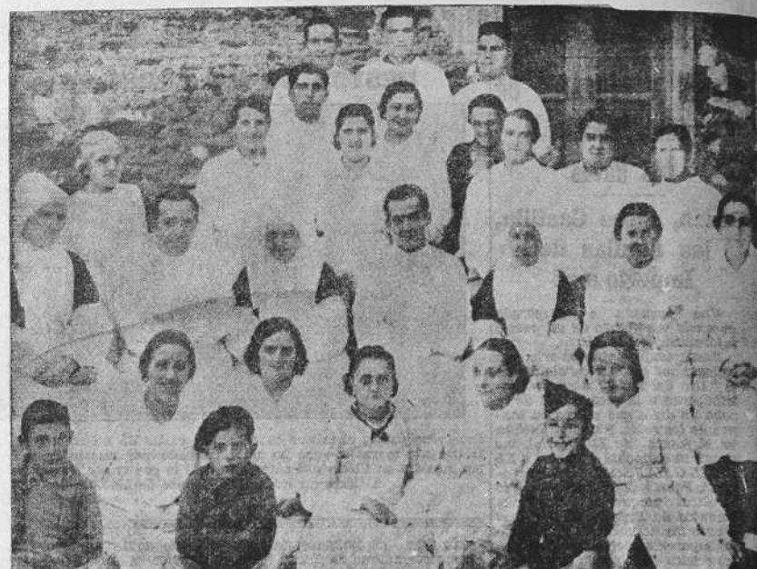
Médicos, practicantes, hermanas de la Caridad y enfermeras que atienden a los heridos hospitalizados en San Pablo, de Mondoñedo