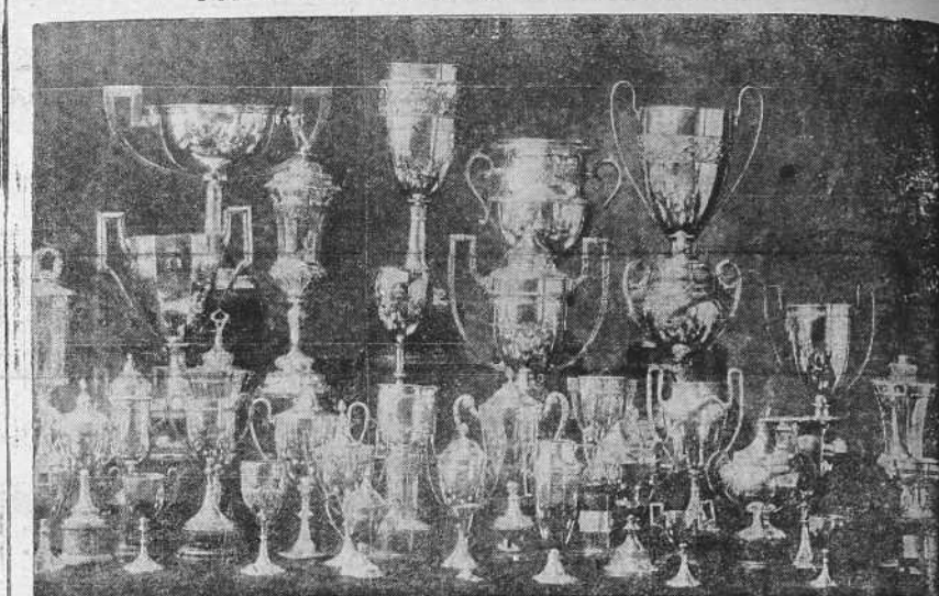
Magnífica colección de copas de plata—trofeos conquistados en competiciones deportivas—que el Club Celta de Vigo ha donado para ser convertidas en vasos sagrados con destino a las iglesias devastadas por el salvajismo marxista en Asturias.