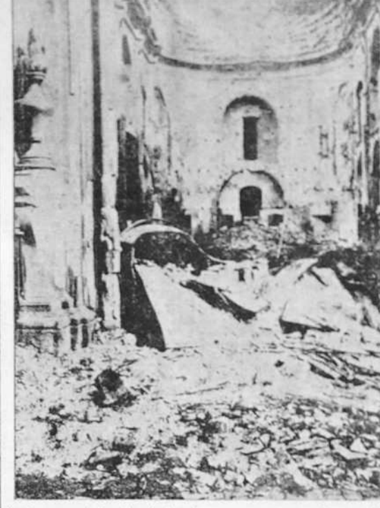
Centenares, quizás miles de templos, que eran encarnación genuina de la fe religiosa...