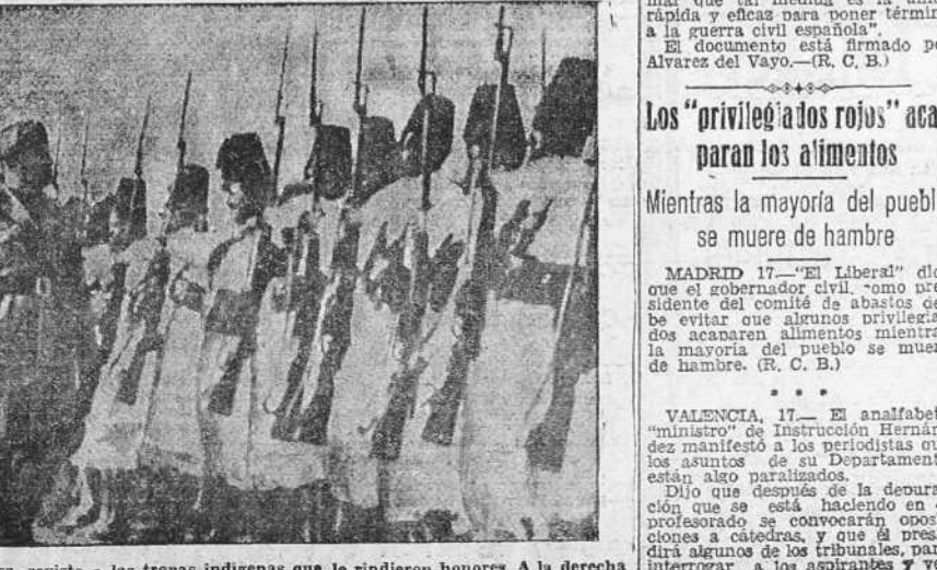
Mussolini a su llegada a Libia pasa revista a las tropas indígenas que le rindieron honores. A la derecha del Duce va el mariscal Italo Balbo, Gobernador general de Libia