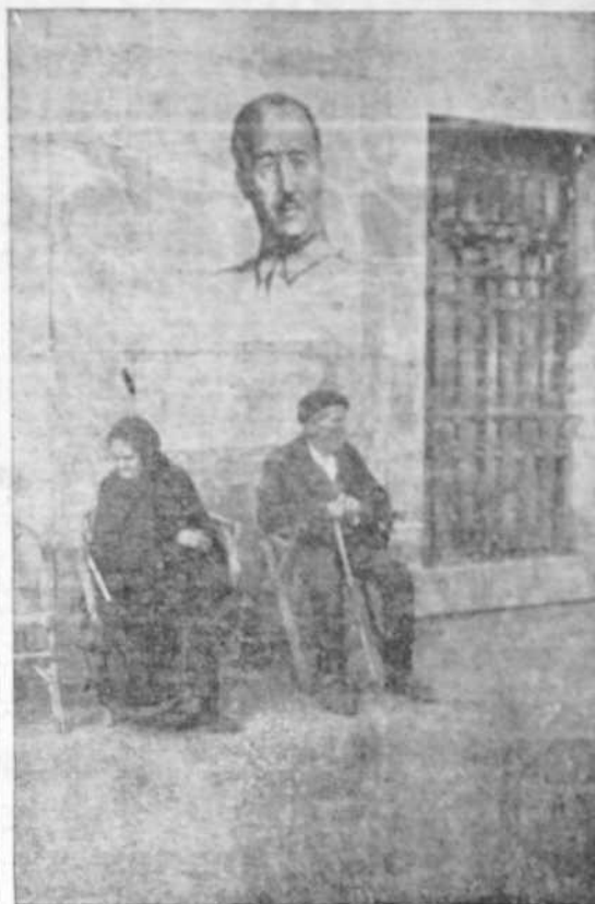
Bajo la gran efigie del Caudillo estos viejecitos desean una feliz España. Saben que los ampara en su invalidez una legislación social que les promete el pan y la justicia. En la España nueva que forja Franco, los veteranos del trabajo no tendrán que mendigar su pan.