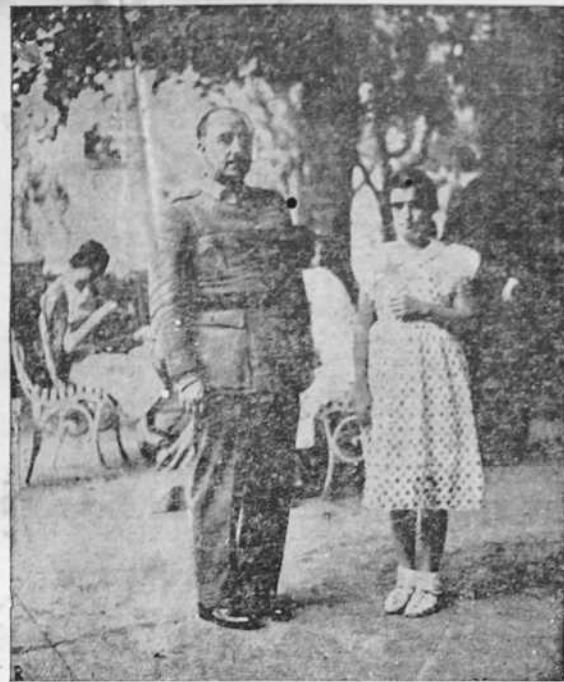
Otra fotografía del Caudillo, tomada en uno de los momentos de descanso al lado de sus familiares