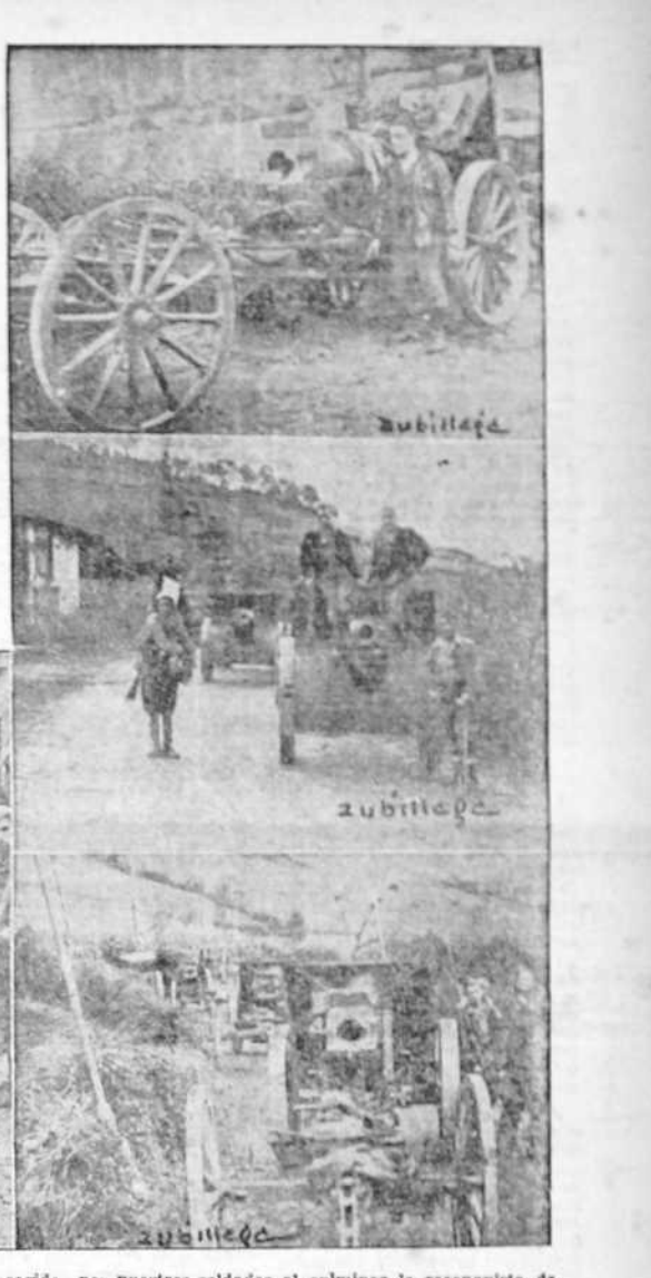
Ya se ha dicho que el botín de guerra corrido por nuestros soldados al culminar la reconquista de Asturias con la toma de la ciudad de Gijón, ha sido enorme, tanto en cantidad como en calidad. He aquí cañones de todos los calibres abandonados por los marxistas antes de su rendición en masa. El jefe de una de las brigadas victoriosas contempla el tripode de una ametralladora que los mineros tenían empalizada en uno de los caminos de acceso a la población gijonesa. ¡Para que sirvan diciendo los cobardes huidos que no tenían arma ni fuerza!

Así se ocuparon también Mieres, Ujo, Turón, Sama de Langreo, todos y cada uno de los pueblos terroríficos de la cuenca minera de Asturias. En contadísimos casos ha habido algún ligero tiroteo, sin que fuéramos que lamentar ni una sola baja por nuestra parte.