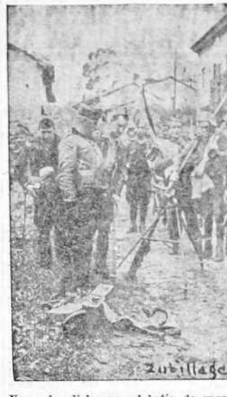
Ya se ha dicho que el botín de guerra corrido por nuestros soldados al culminar la reconquista de Asturias con la toma de la ciudad de Gijón, ha sido enorme, tanto en cantidad como en calidad. He aquí cañones de todos los calibres abandonados por los marxistas antes de su rendición en masa. El jefe de una de las brigadas victoriosas contempla el tripode de una ametralladora que los mineros tenían empalizada en uno de los caminos de acceso a la población gijonesa. ¡Para que sirvan diciendo los cobardes huidos que no tenían arma ni fuerza!