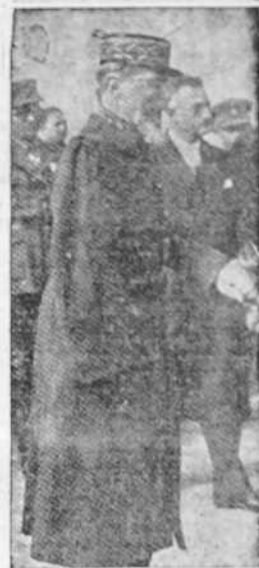
El general Gouraud, que ha pasado a la reserva. Ocupaba actualmente el cargo de comandante militar de París. Fue cinco veces herido

También acordaron dirigir un telegrama al Generalísimo Franco expresándole la admiración que siente la Bélgica sana hacia España y haciendo votos por la definitiva victoria contra el comunismo.—STEFANI.