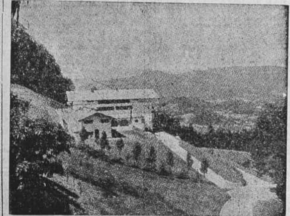
"Berghof", la finca particular de Adolfo Hitler, donde se celebró la entrevista entre Lord Halifax y el Führer

LA MUJER QUE SE MANIFIESTE INADECUADAMENTE, YA POR SUS MANERAS O POR SUS ADORNOS, MERECE LA REPULSA DE TODO ESPAÑOL DIGNO Y DE LAS MUJERES EN PRIMER LUGAR.