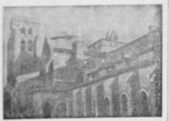
El Monasterio de las Huelgas, en Burgos, fundado por Alfonso VII, el Emperador, el día 12 de febrero de 1132.

En el Monasterio de las Huelgas, en Burgos, se celebró el día 12 de febrero, el aniversario de la fundación del Imperio español. Este día, el monarca de España, el rey Alfonso VII, el Emperador, fundó el Monasterio de las Huelgas, en Burgos, el día 12 de febrero de 1132. Este día, el monarca de España, el rey Alfonso VII, el Emperador, fundó el Monasterio de las Huelgas, en Burgos, el día 12 de febrero de 1132. Este día, el monarca de España, el rey Alfonso VII, el Emperador, fundó el Monasterio de las Huelgas, en Burgos, el día 12 de febrero de 1132.