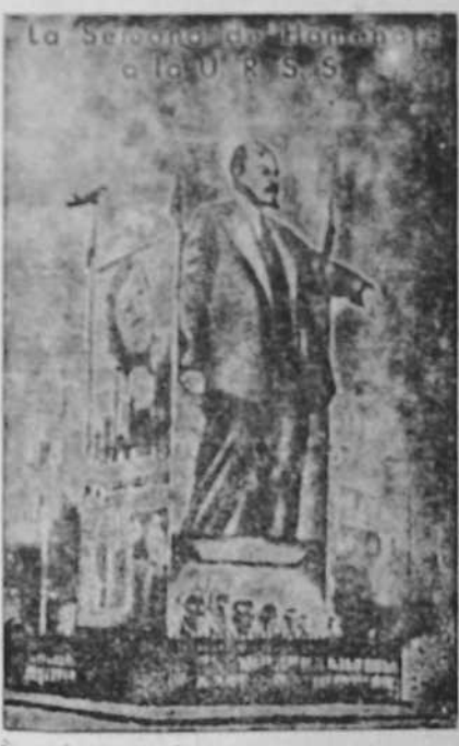
La Sección de Propaganda de la U.R.S.S. (Caption for the photograph of the man in the suit).

serio oficial hubo alusiones a Rusia, en el sermón del día... (Text continues with commentary on a speech or sermon mentioning Russia).