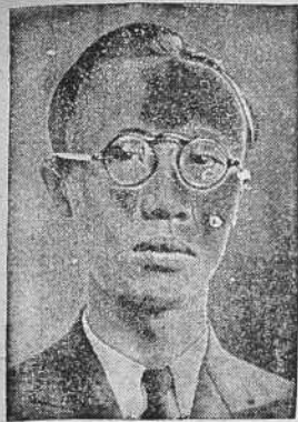
Fu-Yi, Emperador del Manchukuo, que recientemente ha reconocido a nuestro Gobierno