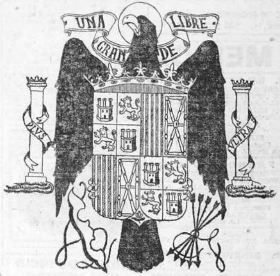
Anterior publicamos el escudo nacional simplificado para uso en los trámites burocráticos. Hoy publicamos el escudo, en su integridad, conforme al decreto del día 2 de los corrientes

La tercera parte de la población está desnutrida y mal atendida