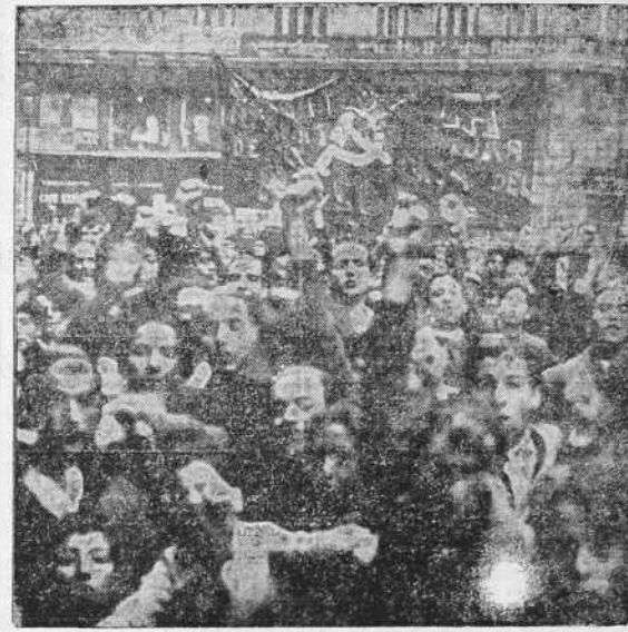
efecto, las "cosas" de España, en aquel día fatídico, de hace dos años, se pusieron mal.

El pórtico de todo eso es el 16 de febrero. Arrastró, por su propia consecuencia determinativa, el desamparado, primero, y la reacción gloriosa luego. Tiene esa fuerza de impulsión y esa dignidad originaria. Pero tiene esa economía estricta, valor intrínseco.