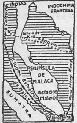
Al Norte de la península de Malaca está el istmo de Kra, que los japoneses piensan transformar en canal con el fin de reducir considerablemente el valor estratégico de Singapur.

El Estado Mayor Naval norteamericano ordenó a sus buques avanzar más allá de las Islas Hawai y de las Filipinas, enviándolos hasta Singapur y Saigon, con el fin de aproximarse cada vez más a la Península de Malaca. Con esto queda demostrado el acuerdo anglo-