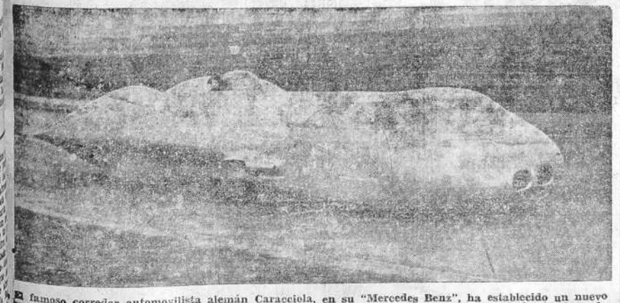
El famoso corredor automovilista alemán Caracciola, en su "Mercedes Benz", ha establecido un nuevo record de clase en la autoestrada Frankfurt-Darmstadt. Consiguio en una prueba de kilómetro lanzado una velocidad de 432'692 kilómetros por hora.

Precisamente de una sola manera: desprenderse de los lazos que nos unen con la Rusia soviética.