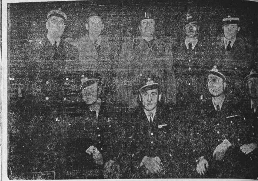
El Duce recibe a su hijo Bruno con la tripulación de los "Ratones Verdes", a su regreso del triunfal "raid a Río de Janeiro"

Se ha reforzado la vigilancia en un campo de aviación donde se están verificando ensayos de un aparato de bombardeo completamente nuevo y cuyas características se mantienen en secreto.