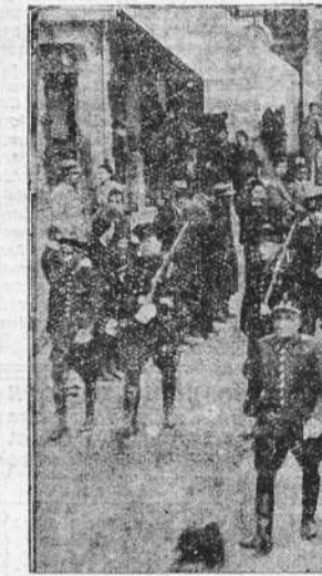
Las fuerzas de Asalto celebraron ayer solemnemente la festividad de su Patrono el Angel de la Guarda. En la parroquia de Santa Lucia se dijo una misa, y después hecho un desfile por las calles de la población. Ambos actos resultaron brillantísimos.

CONFERENCIANDO CON EL SECRETARIO DE ESTADO WASHINGTON, 1. —El nuevo