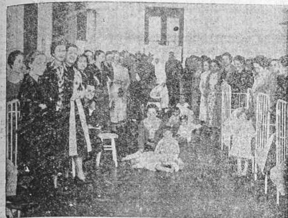
250 JOVENES HAN ASISTIDO AL CURSILLO DEL HOGAR QUE, ORGANIZADO POR LA JUVENTUD FEMENINA DE ACCION CATOLICA, ACABA DE CELEBRARSE EN LA CORUÑA. HE AQUI UN GRUPO DE JOVENES DURANTE LA CLASE DE PUERICULTURA EN LA CASA CUNA (Ver la página cuarta)

Enlazadas ayer las fuerzas de Galicia con las de la división primera, en las proximidades de Alcora, continuaron hoy su progresión ininterrumpida ligadas las fuerzas de ambas unidades, obteniéndose con esta magnífica combinación una definitiva éxito al descender por la carretera de Castellón de Villamalefa al nudo de comunicaciones de Fanzara Onda, escalándose por su parte occidental el vértice de Las