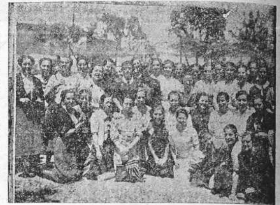
Escuchando una lección de agricultura