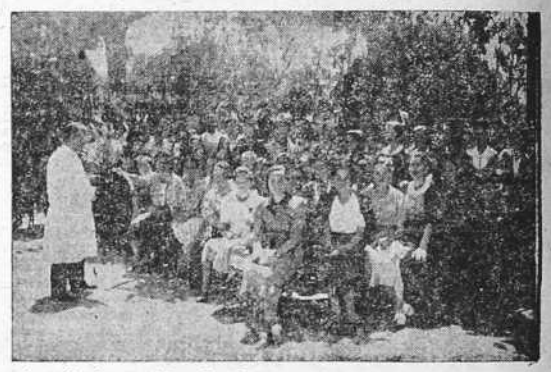
Aprendiendo a cultivar las flores que han de perfumar el hogar

"Quiero que sea Vd. intérprete de la vida de familia con las más altas espiritualidades de la Edad cristiana; que quien espiritualiza la vida, no la destruya, sino que la mejora en todos sus órdenes."