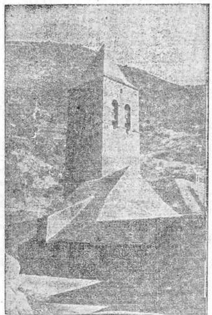
Campanario de Bielsa, en el Pirineo aragonés, donde desde el jueves la gloriosa bandera roja y gualda

Primero fué una vacilación y una sorpresa en los atacantes, que venían, según nos dijo un prisionero, a recuperar Castellón, pensando, quizás, que una ciudad nuestra se recupera fácilmente. Después fué una huida precipitada, desordenada más bien, siendo perseguidos los atacantes de la noche en una extensión de varios kilómetros, por la Rambla de la Viuda hasta el extremo Sur de la carretera de Alcora y cerca de Burriana por el extremo de la costa. Y por el sector más occidental la maniobra envolvente se extendió por las montañas de las Pedrizas, habiéndose logrado al anochecer la ocupación total de este macizo. En esta operación sólo se hicieron más de mil prisioneros, siendo grandísimo el número de armas automáticas recogidas.