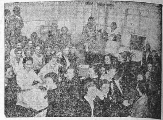
Preparando un plato

ENTREGAS: en los almacenes de los cuantos en el muelle de Trasatlántico