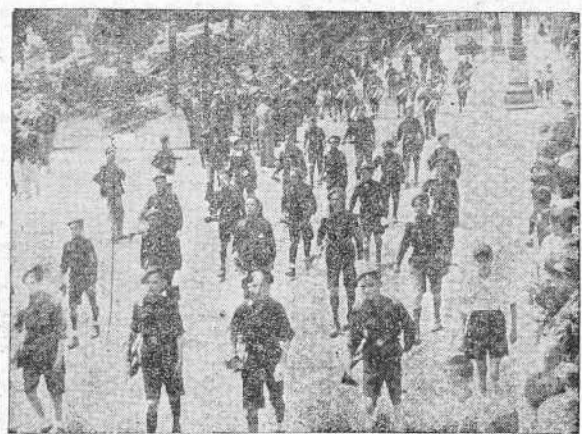
Un grupo de Flechas de las Organizaciones Juveniles de Vizcaya que ayer llegaron a La Coruña, desfilando por el Cantón.

Salamanca, 6 de julio de 1938. Segundo Año Triunfal. De orden de S. E., el general jefe de Estado Mayor, FRANCISCO MARTIN MORENO.