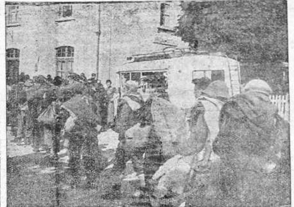
Un grupo de milicianos rojos de la derrotada División 43, en la estación francesa de Arreau, para ser conducidos a Cataluña

No serán entregados a los rojos los cuarenta mil kilos de oro español depositados en el Banco de Francia