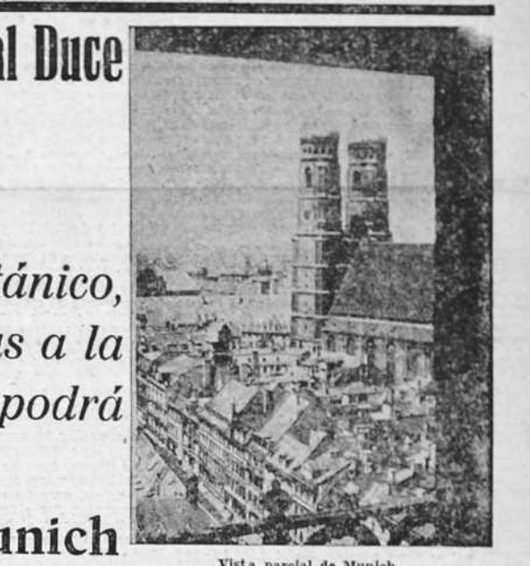
Vista parcial de Munich

de amenaza hacia Checoslovaquia, la cual no podría verse obligada a adoptar medidas defensivas, con lo que se neutralizaba la mediación de lord Runciman. Von Ribbentrop se negó a discutir estas medidas militares, manifestando que los esfuerzos británicos en Praga sólo servirían para aumentar la intranquilidad de los checos. Con motivo de estas informaciones relacionadas con el movimiento de varias divisiones alemanas, Francia, a fines de agosto, adoptó medidas análogas, llamando a los reservistas para completar las guarniciones de la línea Maginot. El 31 de agosto, Mr. Poincaré, ante la Secretaría de Estado del Reich, formuló una enérgica protesta e hizo constar la posible actitud de Inglaterra en el caso de una agresión contra Checoslovaquia. El primer ministro sigue haciendo historia del problema checo y dice que Checoslovaquia se vio obligada a disponer la movilización general a fin de evitar una invasión alemana. Entonces Chamberlain decidió trasladarse personalmente a Alemania, dándose entonces cuenta de que la situación era mucho más grave de lo que había creído. Hitler declaró que, en vista de que el problema de los sudetes no se resolvía por vía pacífica, Alemania se preparaba para una guerra mundial. Sin embargo, discutimos los medios para llegar a un resultado sin tener que recurrir a las armas, pero en la primera entrevista advertí al Cancellier del Reich que, antes de declarar nada en firme, tenía que consultar a mis colegas. Entonces se