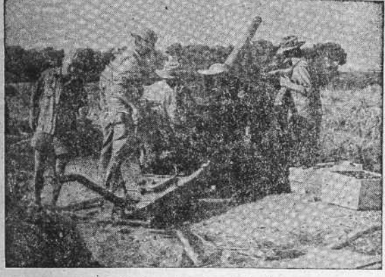
Artillería nacional en el frente

Los rojos sufrieron muchas bajas en Viver y Bélmez al ser rechazados sus ataques