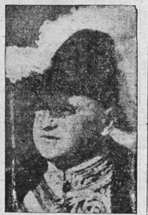
El general Benavides, Presidente del Perú, que inauguró ayer la Conferencia Panamericana

El "Berliner Tageblatt" escribe que los argumentos empleados por los propagandistas de Estados Uni-