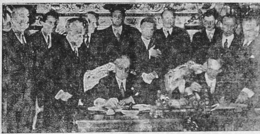
Los ministros de Relaciones Exteriores de Alemania y Francia, señores von Ribbentrop y Bonnet, estampando sus firmas al pie del acuerdo germano-francés

LONDRES, 10.—La victoria del Gobierno Daladier en el Parlamento es comentada extensamente por los periódicos londinenses de esta mañana. La mayor parte de la Prensa inglesa se alegra del triunfo de Daladier frente a los socialistas y comunistas, los cuales apelan a todos los procedimientos para contrarrestar la "política de paz iniciada en Múnich". Sin embargo, se prevé que el actual Gobierno francés se encontrará en un momento muy difícil cuando llegue la hora de votar los decretos-leyes.