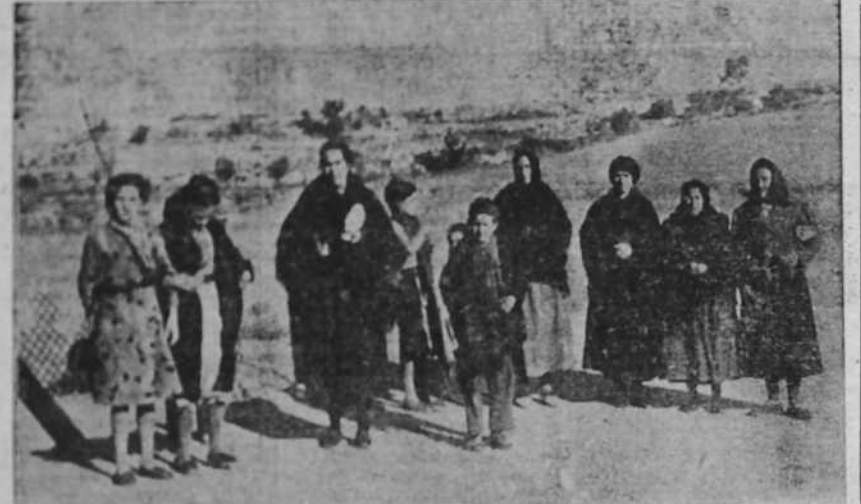
Ha quedado atrás Barcelona y el avance prosigue triunfalmente. Estas pobres familias campesinas piden escapar de las filas rojas y se presentan a los soldados nacionales, de los que reciben inmediatamente el socorro fraternal del alimento y del amparo.