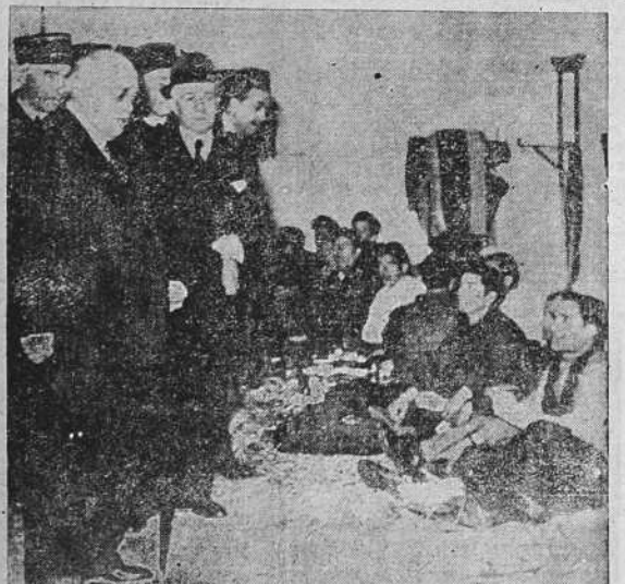
Continúa la entrada en territorio francés de grandes masas de milicianos rojos que abandonan las filas del Ejército del gobierno marxista. El ministro francés M. Albert Sarraut, acompañado del general Fagade y del prefecto de los Pirineos Orientales, M. Didkowski, visita a un grupo de refugiados rojos heridos, que han sido provisionalmente instalados, hasta tanto que el Gobierno francés resuelva sobre el grave problema de los fugitivos, en el fuerte de Vellegarde, en las inmediaciones de Le Perthus.

Mañana saldrán de Burgos con dirección a Barcelona, cuya capital se proponen visitar.—(Logos).