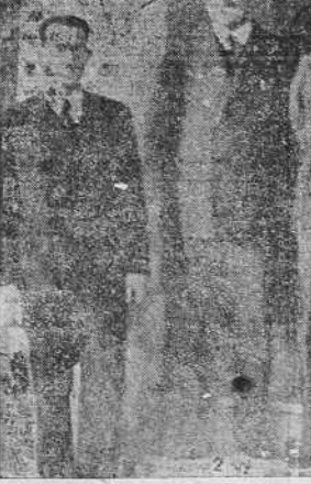
Invitada por el Generalísimo Franco ha llegado a la España Nacional una comisión de críticos militares franceses, que ha recorrido la frontera de los Pirineos, donde ha podido comprobar que no existen fortificaciones de reciente construcción. La Comisión ha llegado a Burgos. En nuestra fotografía figuran los generales Dufewus (1), Duval (2), Tillien (3), el coronel Segone (4), y los periodistas Bromberger (5) y Demartres (6).

Se cree que tendrá lugar antes del día 28 del corriente mes.—(Logos).