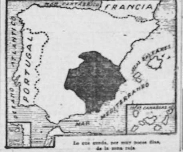
La zona roja, por muy poco día, de la zona roja

Por necesidad con urgencia se ha reunido un breve consejo a esta provincia, se ruega a las personas que puedan facilitar noticias de venir de cualquier clase, para hacer saber a los señores en el local de la Delegación Provincial de Abastecimientos y Publicaciones Libradas, Real, 24, 1630.