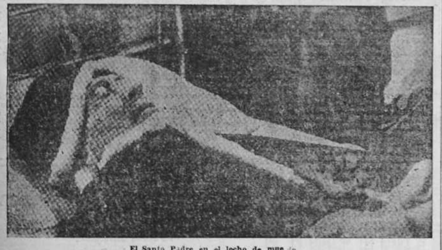
El Santo Padre en el lecho de muerte

oficiales de la brigada internacional que mandaba Lister fueron detenidos por la policía francesa por haberse encontrado numerosas joyas y oro entre los efectos de sus cajas. Otros setenta y cinco milicianos fueron también encontrados por haberse ocupado unos 200 kilos de oro y joyas de gran valor. MILICIANOS ROJOS DETENIDOS EN TOULOUSE PARIS, 15.—Han sido detenidos 21 milicianos rojos que se habían logrado escapar del control y se encontraban en un restaurante de noche, en Toulouse. Entre ellos figuraban seis oficiales que habían llegado a Francia en sus aviones. Todos han sido enviados a un campo de concentración. En cuanto a los milicianos detenidos en Perpignan, se ha sabido que pertenecerán a la brigada de Lister, y fue este mismo quien les autorizó antes de salir de Cataluña a seguir tres camiones cargados de joyas robadas y aprovecharse de cuentas alhajas para sacar llevar y el resto volarlo con dinamita.—(Logos).