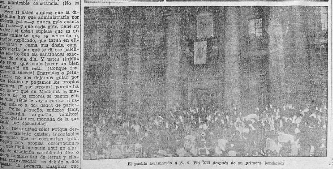
El pueblo aclamando a S. S. Pío XII después de su primera bendición

que para el caso de guerra; dichos buques no serían utilizados para la navegación comercial ordinaria. Muchos rojos ingresan en la Legión Extranjera francesa PERPIÑAN 13.—Muchos de los rojos refugiados en los Campos de Concentración, decidieron ingresar en la Legión Extranjera, habiéndose concedido el ingreso a cien sujetos cada semana. Se sabe que en varios Campos de concentración hubo serios disturbios. No se les permite a los peiodistas acercarse a estos Campos. Varios soldados de las guardias móviles fueron objeto de agresión por parte de los rojos y resultaron heridos algunos de estos guardias.