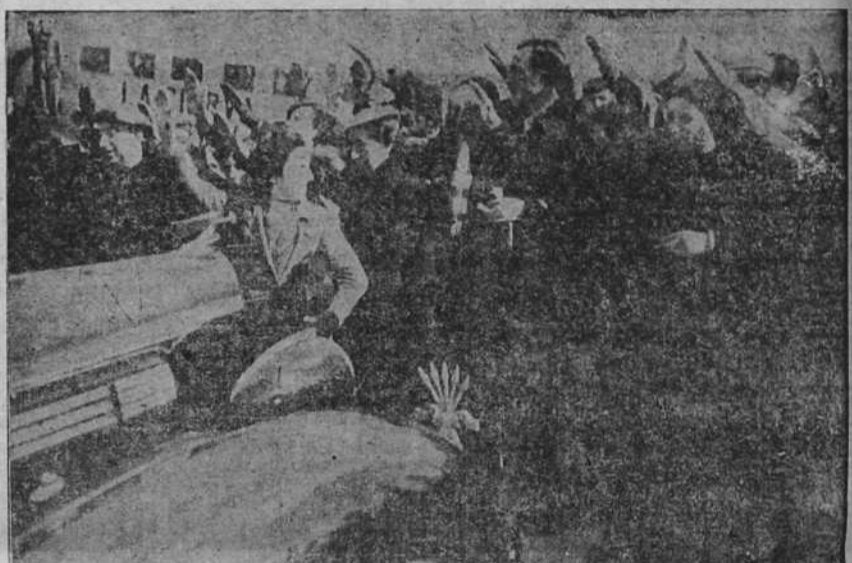
Miguel Primo de Rivera, rodeado de sus hermanos y de un grupo de amigos, saluda brazo en alto al pisar tierra de la España Nacional, en el aeródromo de Vitoria