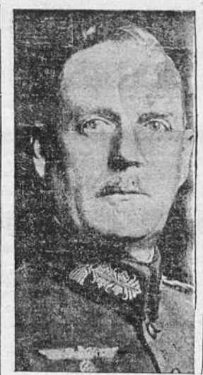
LOS ACONTECIMIENTOS POLITICOS DE CHECOSLOVAQUIA El General Keitel, Generalísimo del Ejército de tierra del Reich y Comandante en jefe de las fuerzas de ocupación de Checoslovaquia.