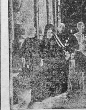
S. S. EL PAPA RECIBE A LA MISION ESPAÑOLA

Los guardias móviles han descubierto en un campamento de concentración un lingote de plata de 18 kilos.