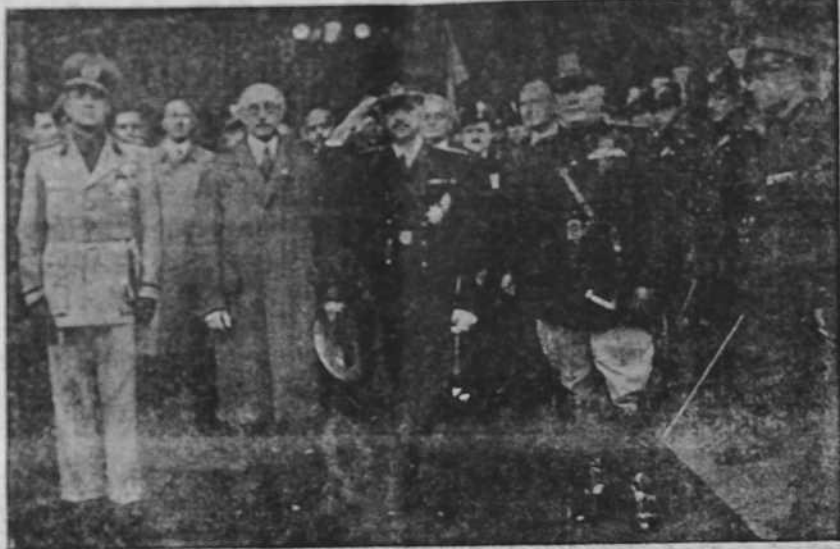
Llegada a la estación Termini, de Roma, del jefe del Gobierno húngaro, conde Teleky, y del Ministro de Negocios Extranjeros, Csaky, que tomaron parte en las conversaciones Italo-húngaras.