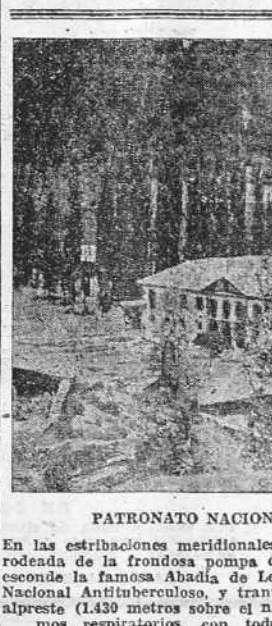
PATRONATO NACIONAL ANTITUBERCULOSO

PARIS, 27.—El Tribunal de París ha condenado a cinco años de prisión a cuatro ex-militarios españoles, entre los que figura un antiguo oficial superior del ejército rojo, que habían intentado robar en una joyería.—Stéfani.