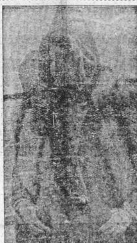
La Reina Isabel de la Gran Bretaña sobre el puente del trasatlántico "Empress of Australia", durante la travesía de la zona helada del golfo de San Lorenzo, donde la navegación del buque fué entorpecida por los témpanos.

Al pueblo español le "AUXILIO SOCIAL" obra de la Falange. Sus comités de Hermandad, reparten comidas calientes en la penumbra de las angustias que llevan a los hogares necesitados vigor de alimento sano y bondad sentido de dignidad. "AUXILIO SOCIAL" realiza la voluntad del Caudillo. "Ni un hogar sin humo, ni un español sin pan."