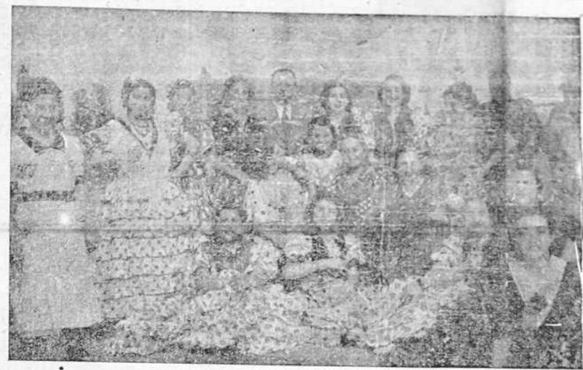
Diez mil muchachas pertenecientes a la Sección Femenina de Falange Española Tradicionalista y de las JONS, se concentraron en Medina del Campo, para rendir homenaje al Caudillo y al Ejército victorioso. El ministro de Agricultura y secretario general del Movimiento, Raimundo Fernández Cuesta, con un grupo de afiliadas andaluzas ataviadas con el traje regional.

Magnífico acierto el de las mujeres de la Falange Española Tradicionalista al elegir un lugar adecuado para rendir su homenaje al Caudillo y tomar nuevos bríos para las tareas de la paz. Medina del Campo, cuna de imperio, cruce de amplios caminos en una llanura escénica e impresionante. Por allí Isabel hizo sus salidas guerreras para ensanchar las tierras de Castilla; y allí se doblegaron al peso de su realce los discolorados magnates aficionados a las banderas políticas y contaminados por la ambición de poderío. Por allí cruza el camino que surca de los ansiosos espirituales Teresa de Jesús, otra forjadora del Imperio; y los sucesos colinas y pobras arroyos que rompen en sombras apenas perceptibles la calma perezosa de las tierras castellanas, Juan de la Cruz, Tras cominos, los tres españoles, los tres convergentes a la meta de la grandeza hispana. Poder, ansias de perfección desparpadas por los pueblos de España y sueños angélicos sin roca con los pastos humanos. Magnífico lugar para emprender las nuevas rutas de la Gran España. Al lado de los viejos muros que contemplaron los últimos instantes de la Reina Isabel. Junto a las piedras que tantas veces oírán los graves consejos del Gran Cardenal de España. Ante los muros que tomaron su fortaleza del alma de una mujer que volta por todo los hombres de su época.