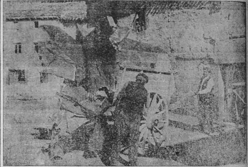
Los restos del avión en que viajaba el general Mola, al ser transportado desde Alcocero de Mola al pueblo de Alcocero de Mola.