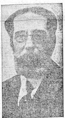
EL MAESTRO ARBÓS

SAN SEBASTIAN, 2. —Esta mañana ha fallecido el glorioso maestro don Enrique Fernández Arbós, director de la Orquesta Sinfónica de Madrid. El Instituto de España, al que pertenecía el finado, colocó la bandera a media asta en señal de duelo. Mañana se celebrará un funeral en el que actuará el Orfeón donostiarra y a continuación se verificará el entierro. El maestro Arbós se encontraba desde hace algún tiempo gravemente enfermo en una finca de Ategorrieta. Había nacido en Madrid, en diciembre de 1863. El maestro Fernández Arbós era conocido y admirado en La Coruña, donde contaba con innumerable número de amigos. Sus visitas, al frente de la Orquesta Sinfónica madrileña, eran algo tradicional de cada primavera coruñesa. Por ello, el maestro tenía también una especial predilección por nuestra ciudad. Al comenzar la guerra, el señor Fernández Arbós se recluyó en una casa del barrio de Ategorrieta, en San Sebastián, donde ayer entregó su alma a Dios. Pérdida totalmente la visión del ojo derecho y con grandes defectos visuales en el izquierdo, el maestro Arbós se dedicó a escribir sus memorias, con la ayuda de su esposa, distinguida dama, también muy apreciada en La Coruña. Refririéndose a sus memorias, el insigne músico madrileño había declarado recientemente a un periodista donostiarra: "En estas "Memorias" quiero exhumar viejos recuerdos. Lo preten-