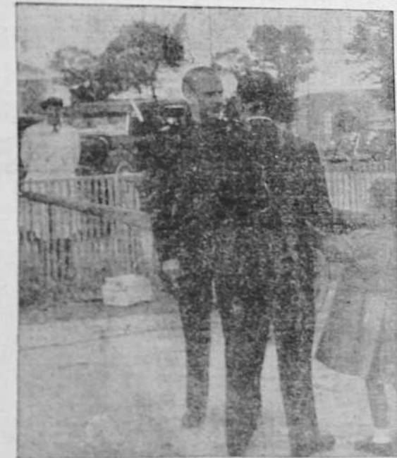
El ministro de la Gobernación, señor Serrano Salder, con uno de sus hijos y el subsecretario del Ministerio, señor Lorenzo Sanz, en el momento de Gamonal, poco antes de iniciar su viaje.

Para reconstruir y hacer habitables el sinnúmero de edificios deshechos por la furia roja se precisa el hierro que se obtiene de la fundición de la chatarra que nos entregues. Ayuda con tu aportación urgente a esta obra nacional. Ofertas: PANADERAS, 35, entrepuerto. Teléfono, 2365