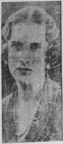
La pintora Irene de Grecia...