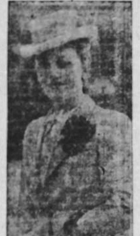
Una elegante vista en un centro de la moda

DORA FRANCISQUITA. —He sentido un relámpago de amor... me siento desahogada, triste, humillada... ¿qué debo hacer? Es tan loco en esta vida, amigos despreciables y humillados, que apenas me permite disfrutar los momentos íntimos de su gran desahogo; fijas en sus propias palabras y verá de una parte un RELÁMPAGO de amor, que no es lo mismo que amor verdadero, y de otra parte una desahoga, que no corresponde a la persona del marido. Luego, o no se ha expresado con propiedad, o estoy por creer que lo que le duele es la HUMILLACION, el sentirse de menos valor para una mujer de verdad. ¿Es verdad? Qué tiempo de perlas a su caso aquel verso de Don Quijote, cuando se refirió a permanecer en el castillo de los duques: