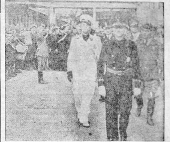
El ministro de la Gobernación, señor Serrano Suñer y el de Asuntos Exteriores de Italia, conde Ciano, pasan revista a las tropas que les rindieron honores a la llegada del ministro español al puerto de Nápoles

El Conde Ciano ha recibido a las 11'45 de hoy al ministro