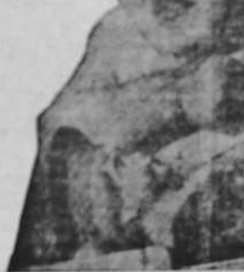
Las personas mayores reaccionan que no nos explicamos y que obedecen a la inclinación que se les dio a sus primeras pasiones en la vida.

Las madres practican por lo general una admirable pedagogía intuitiva, pero a veces tienen propósitos fijos, que pueden ser de mucha trascendencia para la formación de sus hijos.