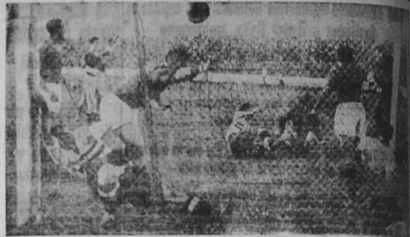
El encuentro internacional de fútbol Yugoslavia-Italia, celebrado el domingo último, en Belgrado, fue jugado con extremado ardor por parte de los jugadores y presenciado por una multitud entusiasta y durante que influyó no poco en el juego violento de los yugoslavos. Nuestra fotografía ofrece un instante de la meca yugoslava que demuestra la envergadura de la lucha.