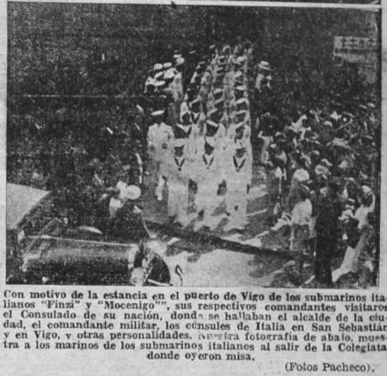
Con motivo de la estancia en el puerto de Vigo de los submarinos italianos "Finzi" y "Mocenigo", sus respectivos comandantes visitaron el Consulado de su nación, donde se hallaban el alcalde de la ciudad, el comandante militar, los cónsules de Italia en San Sebastián y en Vigo, y otras personalidades. Nuestra fotografía de abajo, muestra a los marineros de los submarinos italianos al salir de la Colegiata, donde oyeron misa.