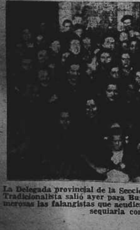
La Delegada provincial de la Sección Femenina de Falange Española Tradicionalista salió ayer para Burgos y, con tal motivo, fueron numerosas las falangistas que acudieron a la estación a despedirla, y obsequiarla con ramo de flores. (Foto EL IDEAL GALLEGO).

RESERVA EN EL FOREIGN OFFICE LONDRES, 4.—El Foreign Office guarda un discreto silencio acerca del contenido de la respuesta soviética enviada a Londres. Esto contraría la creencia general de que el pacto sería concluido inmediatamente.