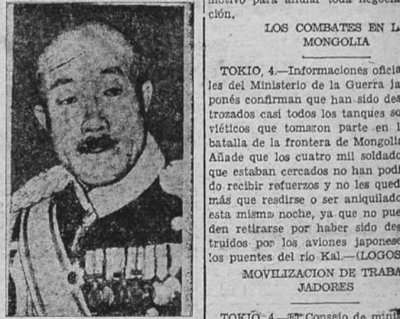
El ministro de la Guerra del Japón, general Itagaki, artículos alimenticios, especialmente la leche y el carbón. PREPARANDO LA CONFERENCIA

recibido instrucciones para que haga saber que cualquier repetición de malos tratos a súbditos británicos deberá ser considerada como motivo para anular toda negociación.